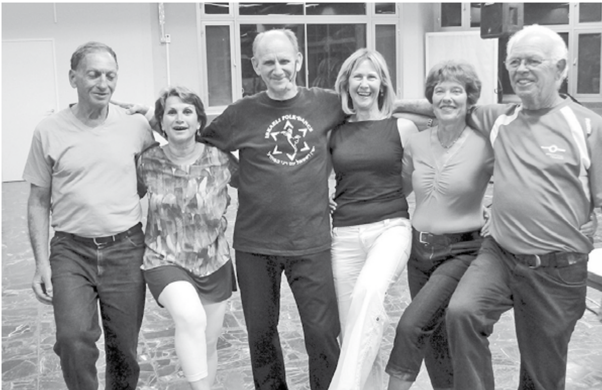
ותיקי החוג מ-1967