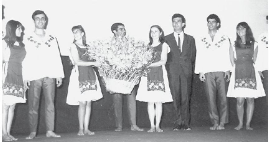
עם להקת הסטודנטים מחיפה, באחד המופעים בחו"ל