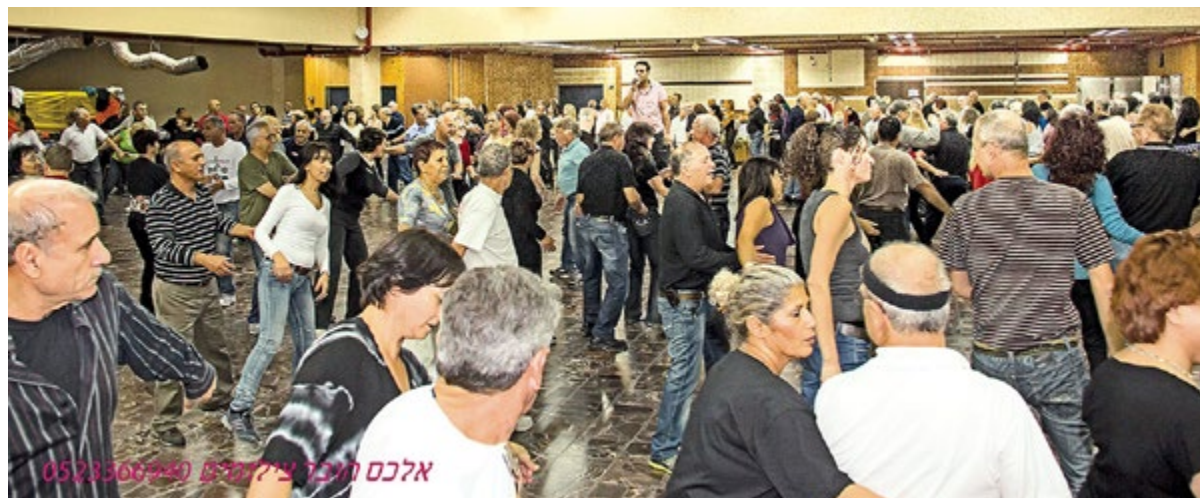
אלכס הינר צילמה 05235067

"תאהב את מה שאתה עושה. תגדל את הרוקדים שלך עם כנפיים גדולות כמו של נשר שיוכלו לעוף למרחקים ארוכים. תן להם יסודות בסיסיים בריאים, שילמדו כל דבר, שיוכלו להתמצא במרחב".