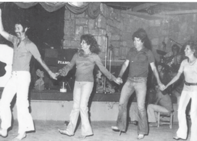
אכזיב. בצד ימין אהוד מנור ועפרה פוקס רוקדים יחפים

יונתן כרמון: "אהוד היה איש משכיל וידען גדול, יחד עם זה היה צנוע ועממי. הוא לא זלזל בשום עניין, גם לא במחול העממי כמובן. להיפך, ריקודי העם נשארו תמיד חלק ממנו".