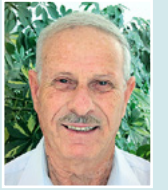
דוד בן אשר