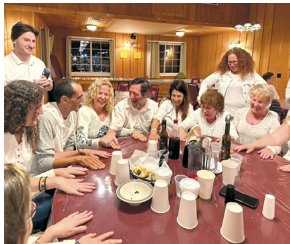
משחקים בחדר האוכל