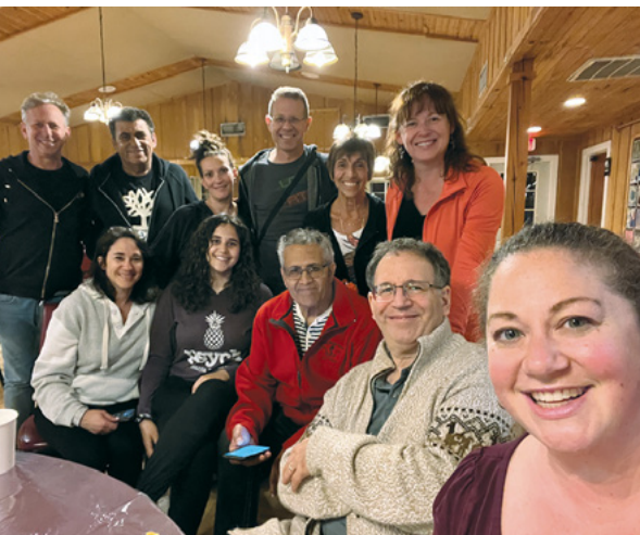
הצוות של הורה שלוש