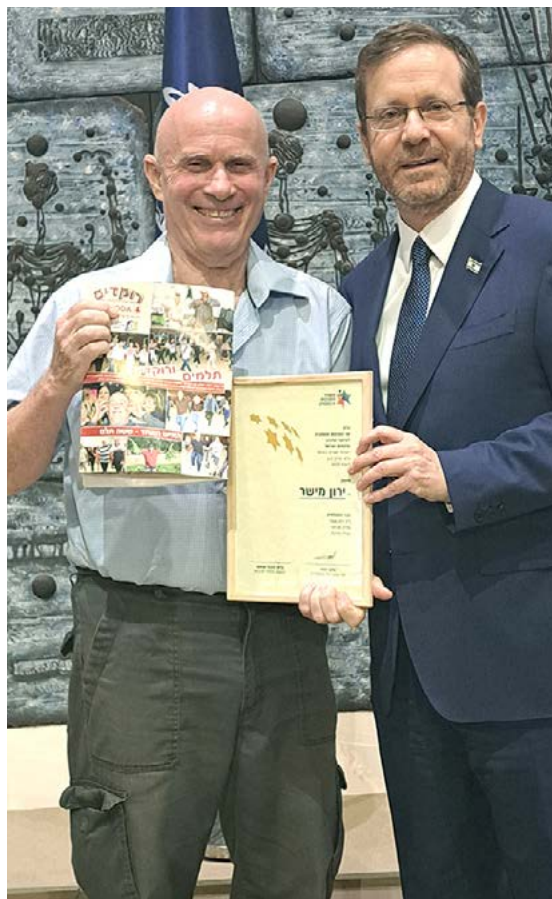
הנשיא יצחק הרצוג וירון מישר

אני מבקש להודות לכל העוסקות והעוסקים במלאכה, לך יידי שר התרבות והספורט מיקי זוהר, לחברות וחברי וועד נאמני הפרס, הוועדות