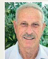
דוד בן אשר