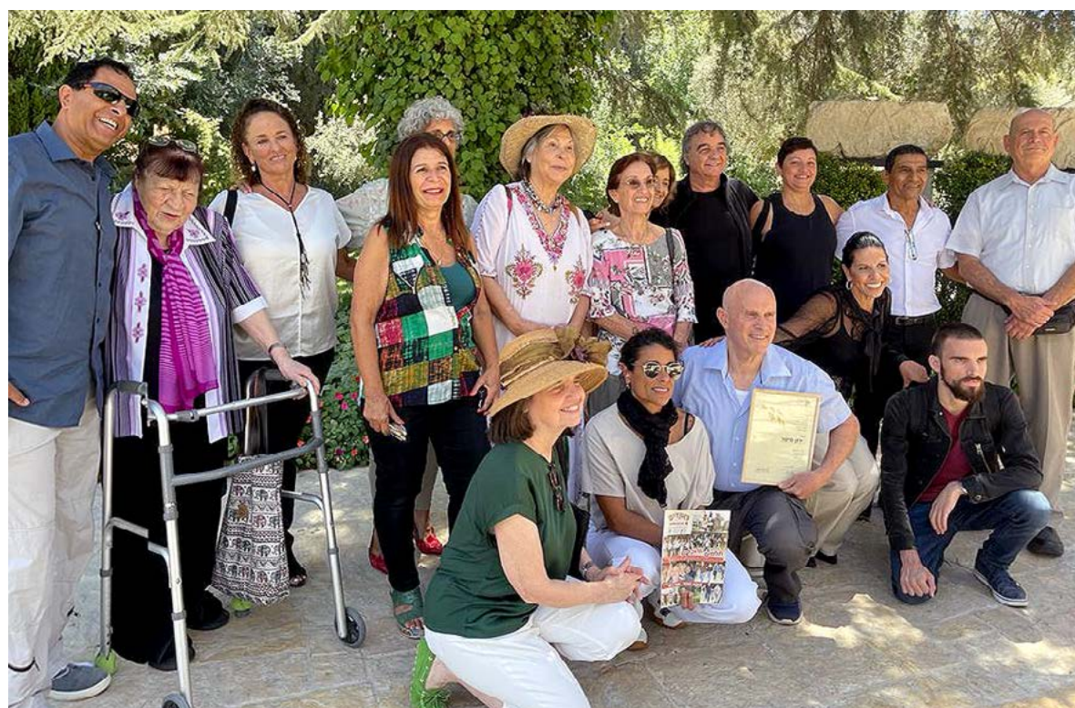
החברים שבאו לפרגן