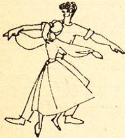
הריקוד: שמואל כהן (ויקי) הלחן: משה וילנסקי

המרחב כולו נצוד צינורות פרסו הרשת והנה סימן ואות בטיפין נראית הקשת ברית הפרח והניר ברית השקט והזמר ממטרה שירך הוא שיר רנניהו עד אין גמר סובי, סובי ממטרה הי פזמון: