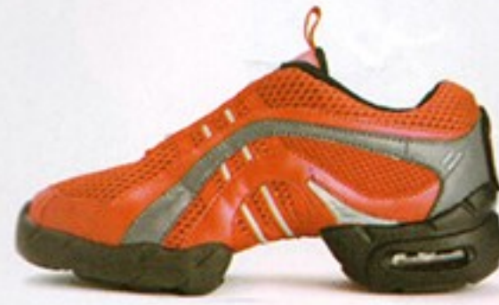
דגם S0545 • מחיר - 550₪ • מבצע 399.99₪