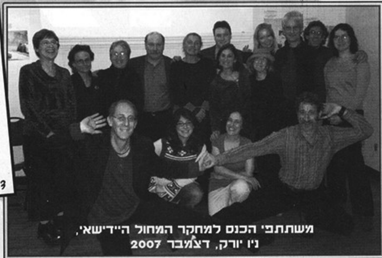
משתתפי הכנס למחקר המחול היידישאי, ניו יורק, דצמבר 2007

או במעבר לריקוד אחר. גמישות זו היא מאפיין מרכזי של המחול היידישאי. מבנה הריקודים כלל מעגלים פתוחים או סגורים, מחרוזת ריקודים בריבוע או בשורה, ריקודי זוגות וריקודי סולו. על-פי מידת הזיקה הדתית של הקהילה, הריקודים נערכו בהפרדה בין גברים לנשים או בקבוצות מעורבות. במקרה השני, שימשו מטפחות כאמצעי חציצה בין הגברים לנשים בכדי למנוע מגע ישיר ביניהם.