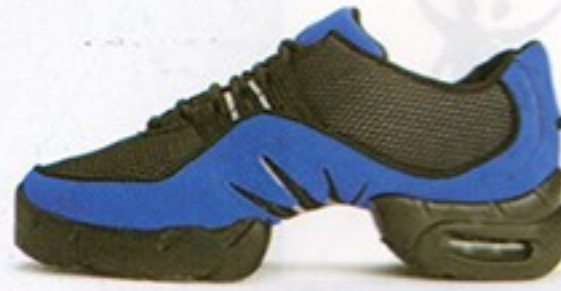
דגם S0538 • מחיר - 500₪ • מבצע 349.99₪