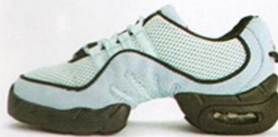
דגם S0538 • מחיר - 500₪ • מבצע 349.99₪