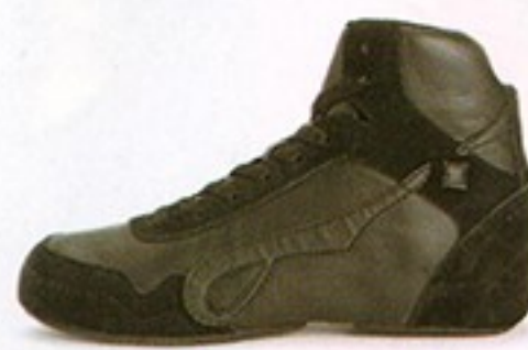
דגם S0590 • מחיר - 500₪ • מבצע 399.99₪