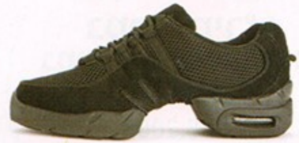
דגם S0538 • מחיר - 500₪ • מבצע 349.99₪