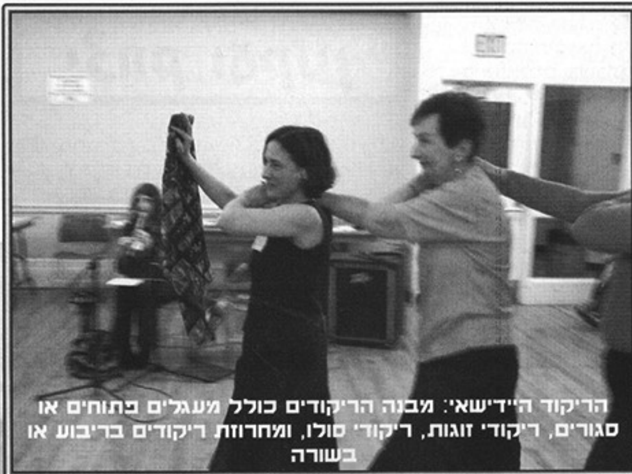
הריקוד היידישאי: מבנה הריקודים כולל מעגלים בתוחים או סגורים, ריקודי זוגות, ריקודי סולו, ומחרוזת ריקודים בריבוע או בשורה