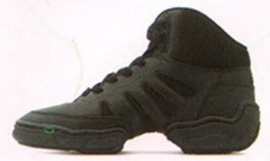
דגם S0500 • מחיר - 500₪ • מבצע 249.99₪