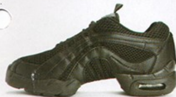
דגם S0545 • מחיר - 550₪ • מבצע 399.99₪