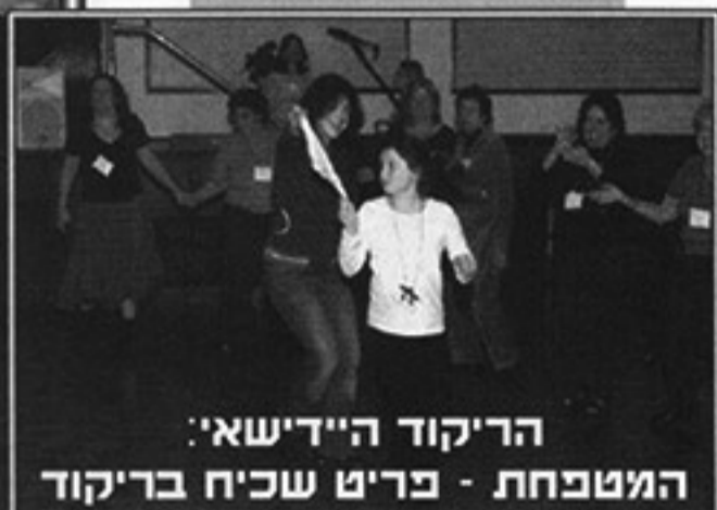
הריקוד היידישאי: המטבח - פריט שכיח בריקוד

חיים, שהיה דינמי ורענן בכל פעם שניקד מחדש. בניגוד לריקודי-עם ישראלים, שבהם לכל מנגינה יש ריקוד-עם כוריאוגרפיה משלו, המחול היידישאי הוא יותר כוללני. סיגנונות מחול אינדיבידואליים יכולים להתבצע למנגינות שונות ולחילופין, ריקודים שונים יכולים להתבצע לנעימה של מנגינה אחת. בשטעטל לא היו כוריאוגרפים שהגדירו את צעדי המחול. אולם לעיתים היו מובילי מחולות ("המנצח על המחולות") שקראו בשמות הצעדים ולימדו חלק מהריקודים שלא היו מאולתרים. בכל סיטואציית מחול, הריקוד יכול היה בגמישות לשנות צורה לצורת מחול אחרת, וחוזר חלילה. האילתור יכול היה להתרחש אפילו בריקודים מובנים יותר, לפני שהרקדנים חזרו לצורת הריקוד המקורית,