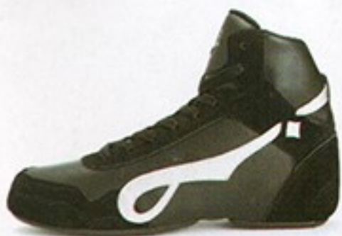
דגם S0590 • מחיר - 500₪ • מבצע 399.99₪