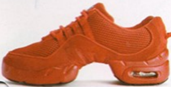
דגם S0538 • מחיר - 500₪ • מבצע 349.99₪