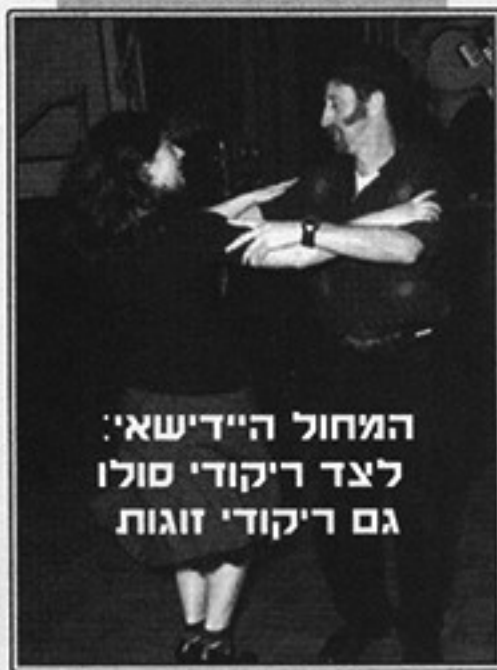
המחול היידישאי: לצד ריקודי סולו גם ריקודי זוגות

במהלך הכנס נוסדה "קבוצת הפעולה של המחול היידישאי" (the Yiddish Dance Action Network). קבוצה זו שמה לה למטרה לאתר מידע חדש אודות המחול היידישאי. מקורות מידע אלה יכולים לכלול זיכרונות של הריקודים ממידענים מבוגרים, צילומים ביתיים של שמחות משפחתיות שבהם מופיעים הריקודים, זיכרונות כתובים הדנים בריקודים, וכל מקורות מידע נוספים. אנשים המעוניינים לשתף במידע מסוג זה, או מעוניינים להצטרף לקבוצת הפעולה של המחול היידישאי, מוזמנים לפנות אל: