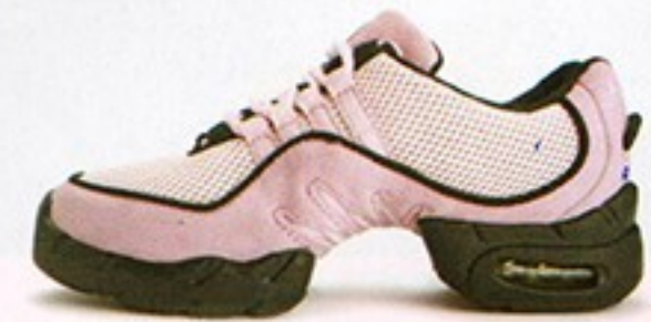
דגם S0538 • מחיר - 500₪ • מבצע 349.99₪