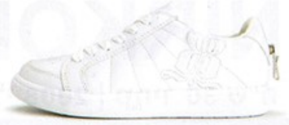
דגם S0515 • מחיר - 520₪ • מבצע 349.99₪