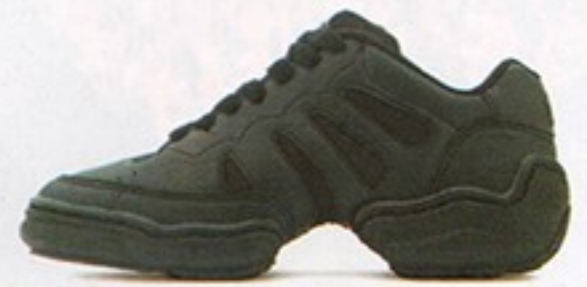
דגם S0503 • מחיר - 450₪ • מבצע 199.99₪