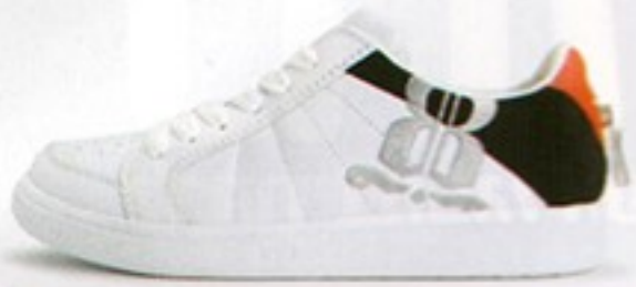
דגם S0515 • מחיר - 520₪ • מבצע 349.99₪