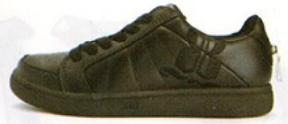
דגם S0515 • מחיר - 520₪ • מבצע 349.99₪