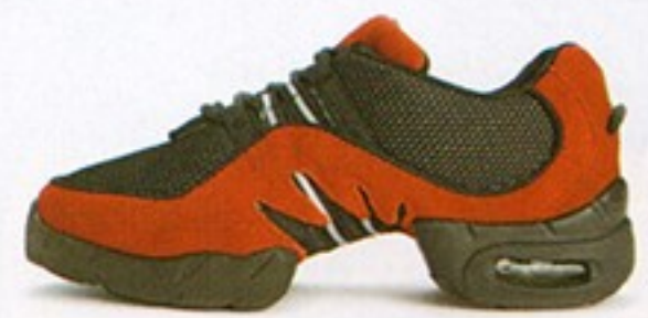
דגם S0538 • מחיר - 500₪ • מבצע 349.99₪