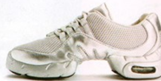
דגם S0538 • מחיר - 500₪ • מבצע 349.99₪