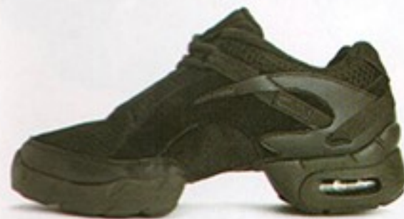
דגם S0560 • מחיר - 550₪ • מבצע 399.99₪