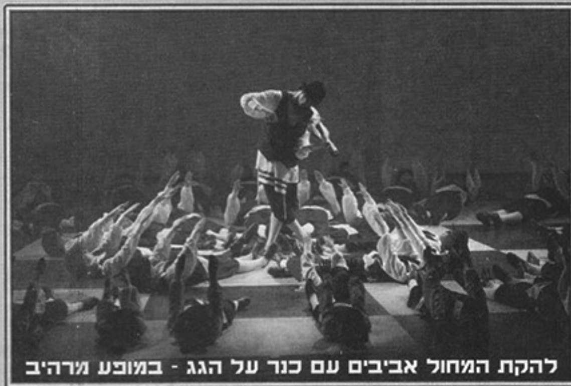
להקת המחול אביבים עם כור על הגג - במופע מרהיב