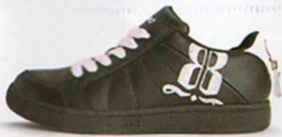
דגם S0515 • מחיר - 520₪ • מבצע 349.99₪