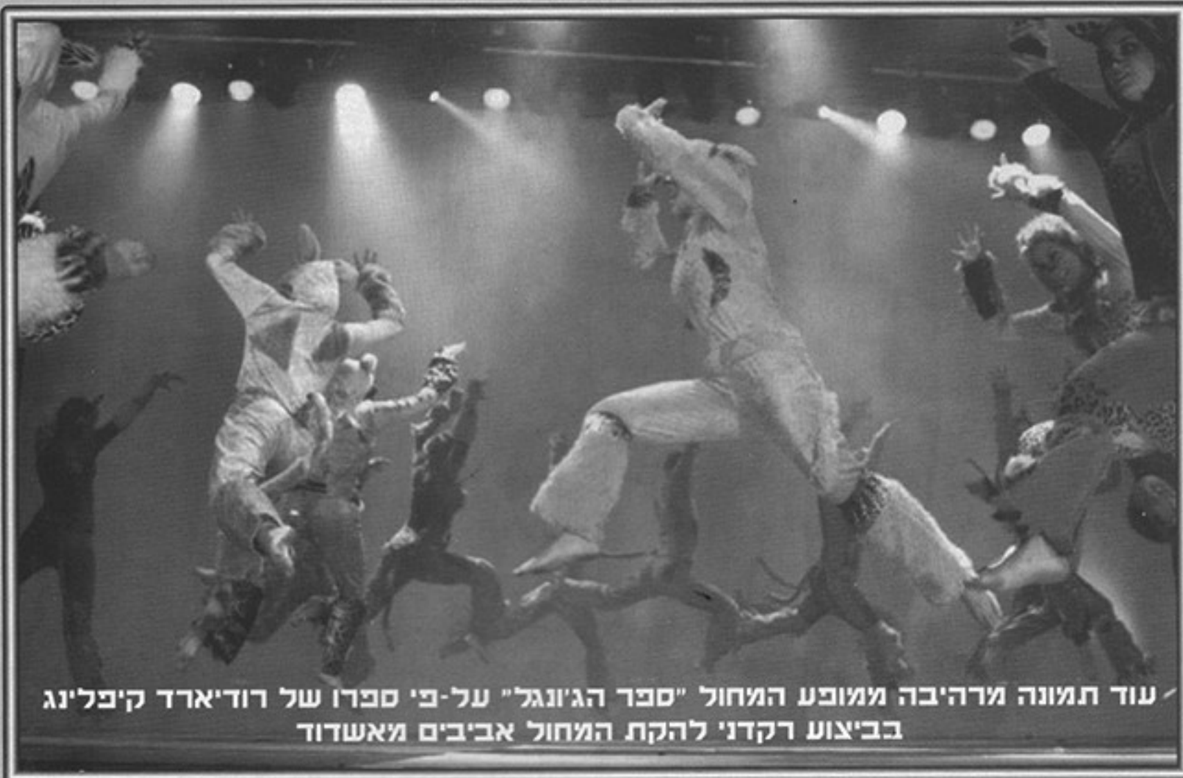
עוד תמונה מרהיבה ממופע המחול "ספר הג'ונגל" על-פי ספרו של רודיארד קיפלינג בביצוע רקדני להקת המחול אביבים מאשדוד

אומנם רקדני להקת המחול אביבים אינם בעלי יכולת טכנית גבוהה כמו רקדני בלט קלאסי, אך בעבודה קשה ובכוריאוגרפיה מוצלחת הם נראים מקצוענים אמיתיים לכל דבר על הבמה