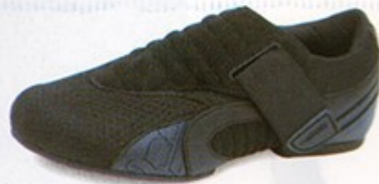
דגם S0580 • מחיר - 400₪ • מבצע 299.99₪