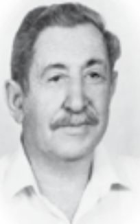
ד"ר צבי פרידהבר

בזמנו ריקודי-עם. לאחר מותו הועבר הארכיון לספריה למחול באדיבות המשפחה, עמיר מלכה ועמיחי.