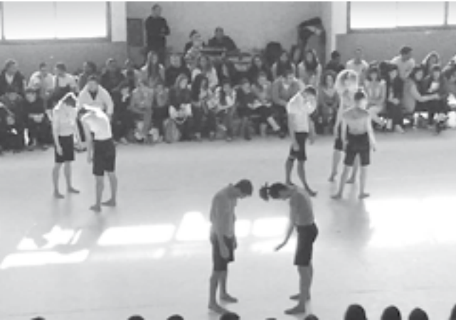
להקת המחול הקיבוצית הצעירה בתיכון מקיף רמות בבת-ים