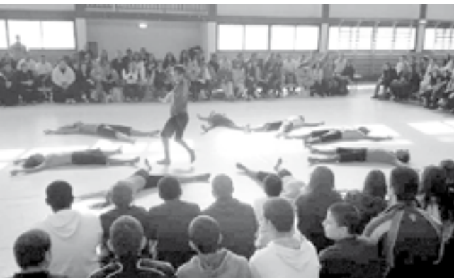
הקהל מושב מסביב וההופעה בגובה העיניים