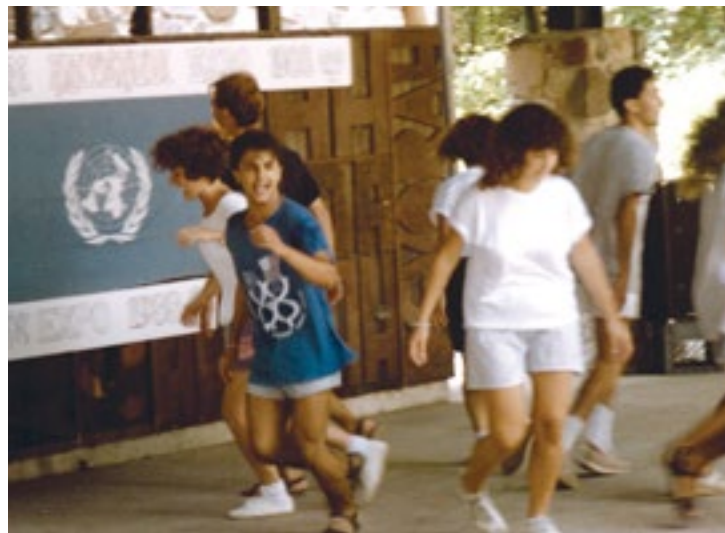
עם המשלחת הישראלית, מחנה קיץ 1988, מישגן