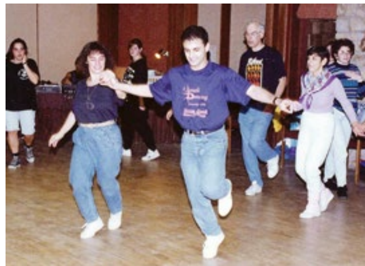
מחנה עצמאות, קליפורניה