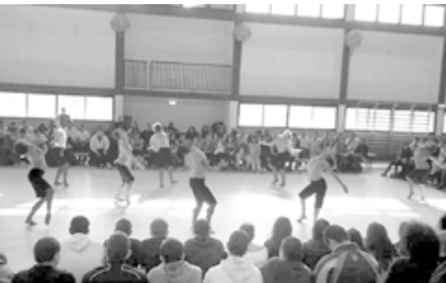
רבים מהתלמידים לא הסירו מבט מהרחבה

מ ה שהתחיל בצחקוקים של מבוכה מצד הקהל הצעיר של תלמידי התיכון, הסתיים במחאות כפיים סוערות וארוכות. שלושה רקדנים וחמש רקדניות של להקת המחול הקיבוצית הצעירה, בהחלט עשו את זה לתלמידי החטיבה העליונה של תיכון מקיף רמות בבת-ים . תוך שלוש דקות הוחלפו הצחקוקים בסקרנות, דומיה, מתח וריתוק אל רחבת אולם הספורט של בית הספר. לצפייה בהופעה, הקהל הושב מסביב; ובגובה העיניים - הופעת המחול "קיבוצית 360" של הכוריאוגרף רמי באר . ניכר שבאר תכנן היטב ובקפידה את הכוריאוגרפיה של המופע. צורת הישיבה ואופי קהל היעד נלקחו בהחלט בחשבון, או פשוט תוכננו כך, ובהתאם - ההופעה.