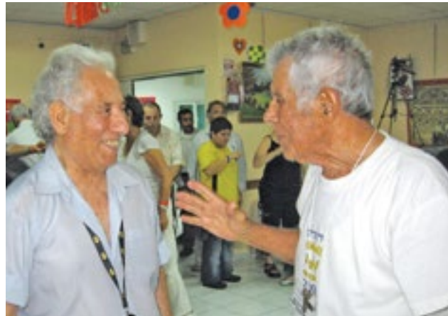
מה אליהו מסביר ליענקל'ה?