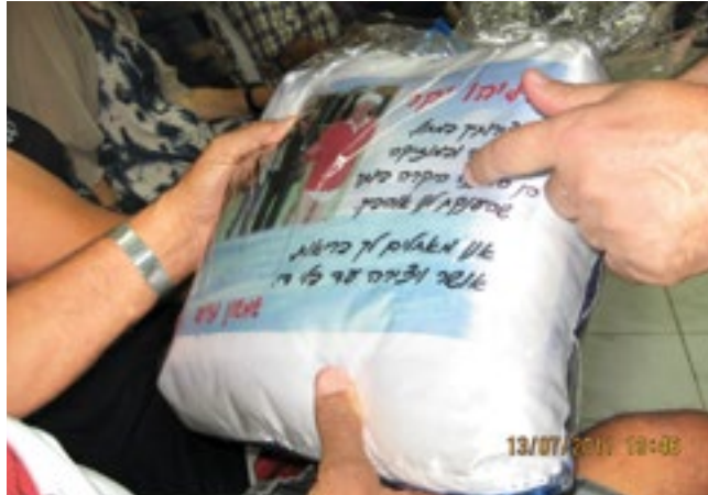
מתנות וברכות לחתן השמחה