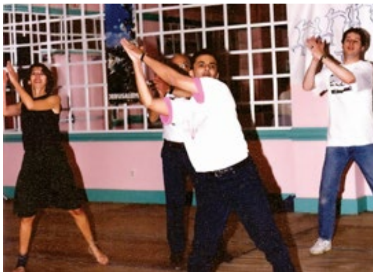
מחנה ריקודיה, מעלה מדינת ניו יורק