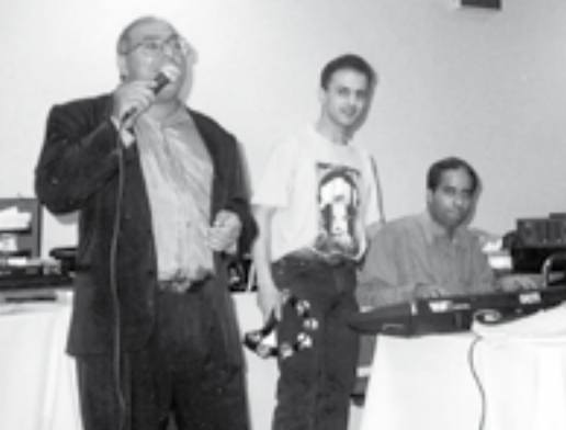
עם דקלון - שרצל עץ תמר בהרקדה עם תיזמור חי, מנהיגים