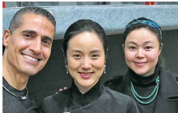
עם הזמרת חה-חוי מסין חה חוי שרה בטכס הפתיחה באולימפיאדת ביגין, וחברתה

אבל גולת הכותרת של הפעילות השנתית, הינה "קמפ בתנועה - פסטיבל ריקודי העם של ישראל" שהוא מקיים מדי שנה במשך 4 ימים באילת. השנה השתתפו בקמפ