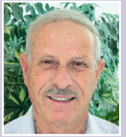
דוד בן-אשר