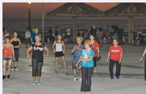
הרקדנים מהונג קונג בזמן שקיעה בחוף נירוונה בחיפה בחברת רוקדנים ישראלים