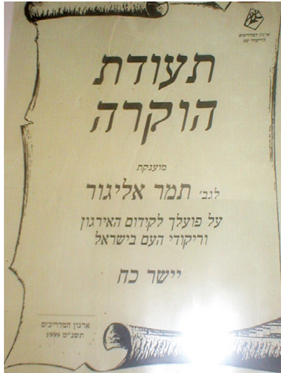
יקירת ארגון המדריכים, 1999