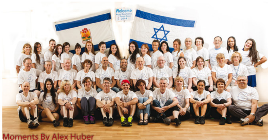
Moments By Alex Huber