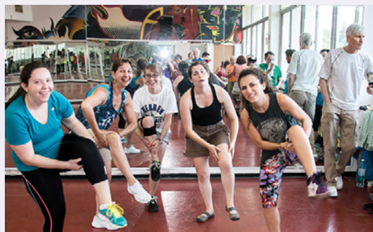
רקדניות מתלוננות על כאבי רגליים לאחר שבוע של ריקודים ברחבי הארץ