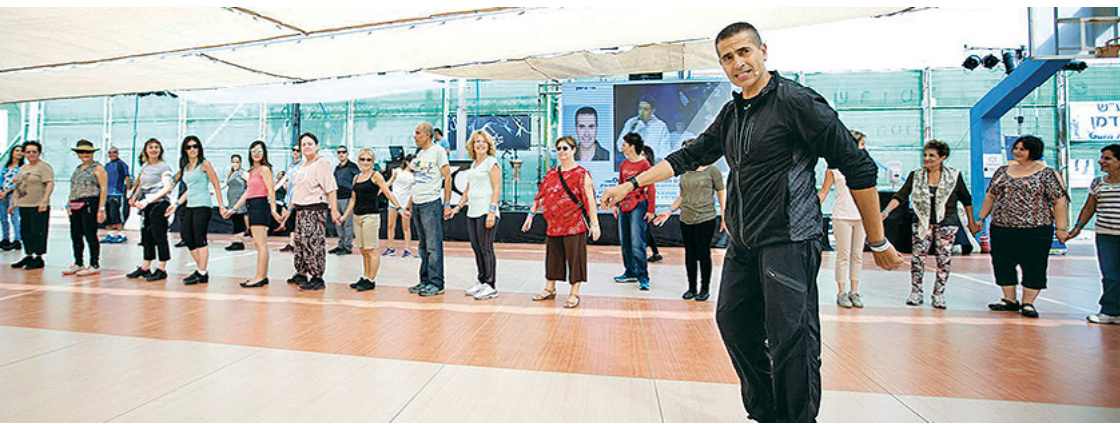
מלמד ריקוד ב"קמפ בתנועה" באילת