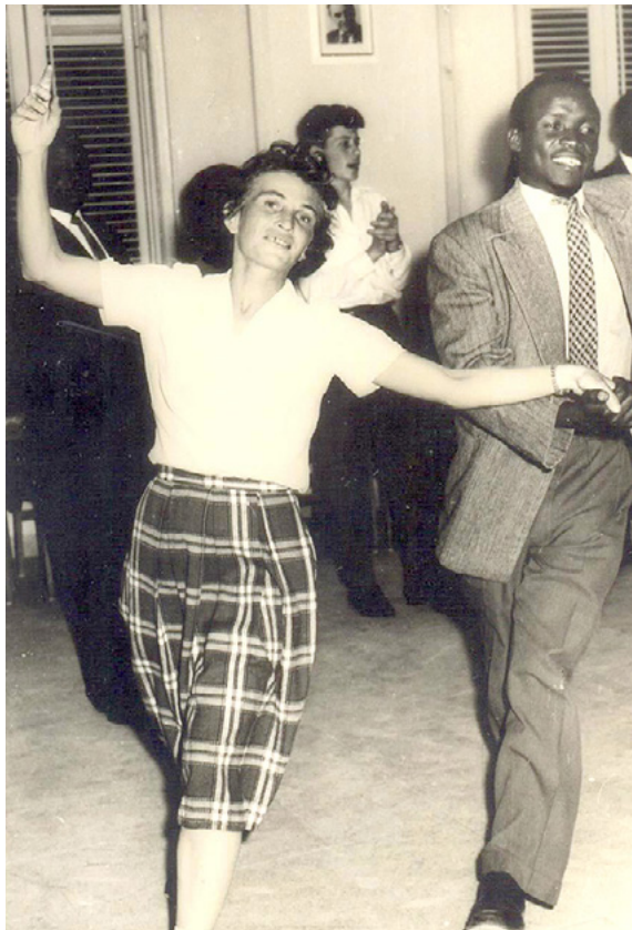
רוקדת בבית פעילי ההסתדרות