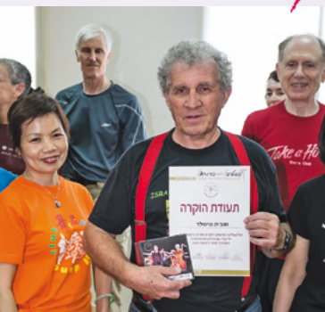
לכל אחד מהכורגרים המלמדים בקורס נתנת תעודת הוקרה מקורית CD עם כל הריקודים שנלמדו במשך הקורס