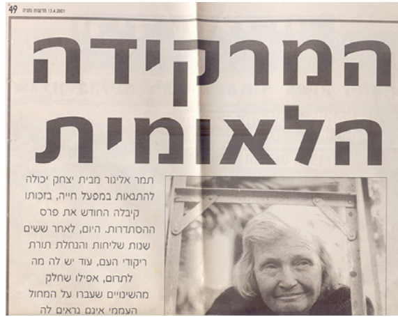
"המרקידה הלאומית" - פרס נמר, 2001, (ידיעות אחרונות)