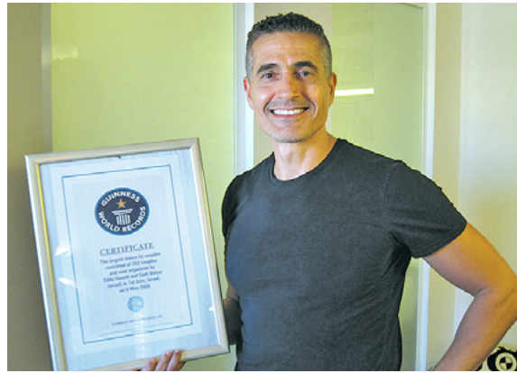
עם תעודת שיא גינס

כ-2,500 רוקדים שחוו הפנינג ענק של מופעים עם מיטב אמני ישראל, הרקדות, סדנאות ומסיבות. בקמפ זה רקדו גם 1,200 ילדי אילת בהפעלה מיוחדת.