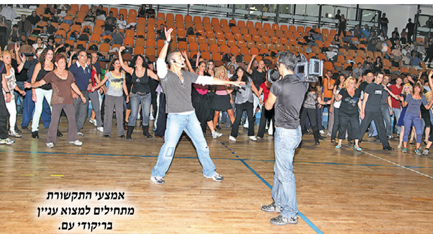
אמצעי התקשורת מתחילים למצוא עניין בריקודי עם.