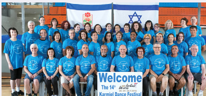
תמונת מחזור של הקורס למדריכי חול בפסטיבל המחולות 2015 משתתפים בקורס רוקדים 9-9 מדינות מסביב לעולם