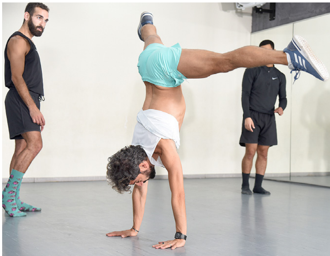
מתוך חזרות.