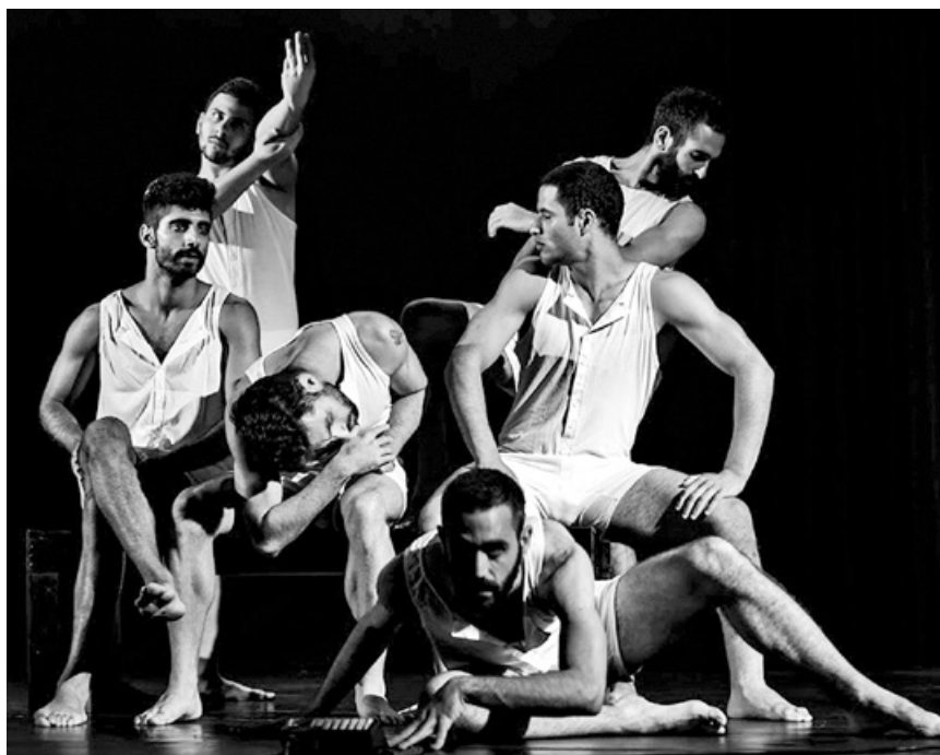
מתוך יצירה "גם בנים רוקדים", הוריאוגרפיה: יניב הופמן.

אבל בעיני, אנחנו משיגים את זה ממקום אחר ועם ערך הרבה יותר גדול.