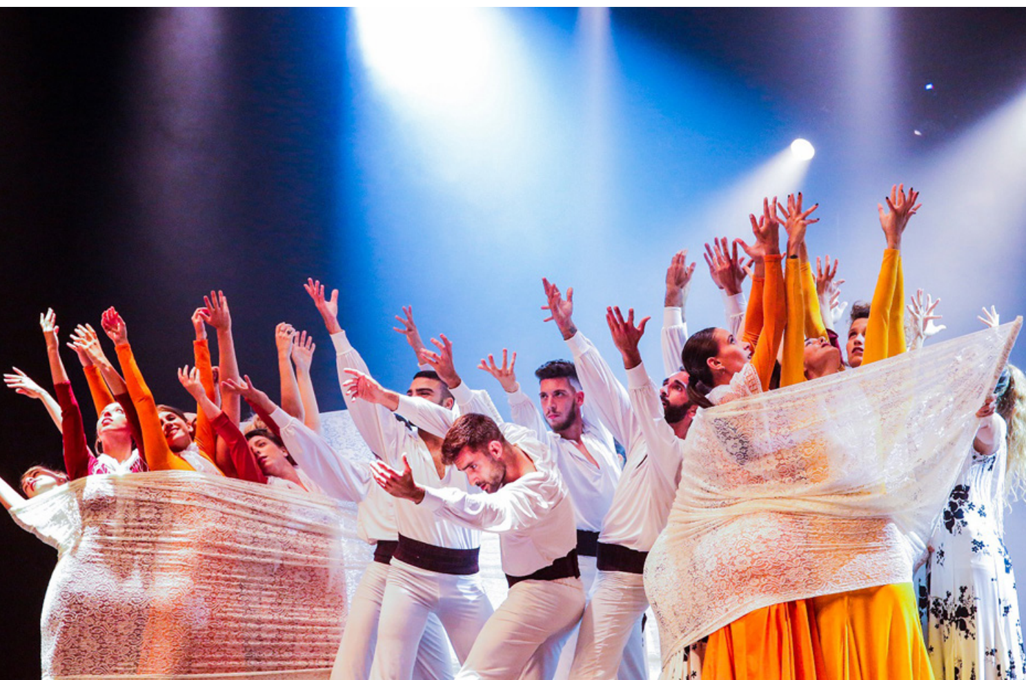
"ימי תשובה".

"אני חושב שאני מאוד, מאוד משמר את העבר ומכבד את העבר. אני רק מוצא את הדרכים האטרקטיביות להביא אותו לדור הצעיר כדי שהם ירצו להיות שם.: