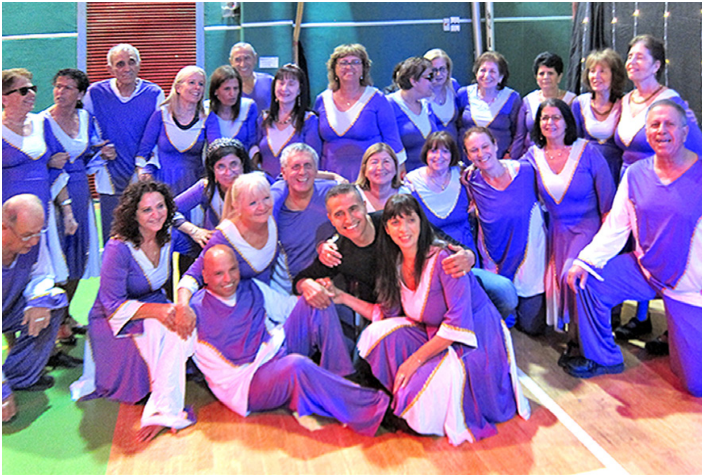
להקת העוורים עם גדי ביטון

חסרה מודעות מספקת בציבור ולא תמיד קל למצוא מתנדבים מלווים, שעושים עבודת קודש בהתנדבותם זו. אולי כתבה זו תעורר את הנוגעים בדבר ליתר תשומת לב לצרכים החיוניים הללו של קהילת העיוורים בישראל.