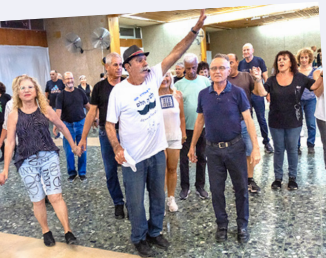
במרכז המעגל ובמרכז העניינים