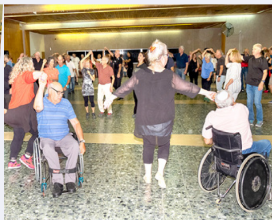
גם יושבים-עומדים רקדו איתנו