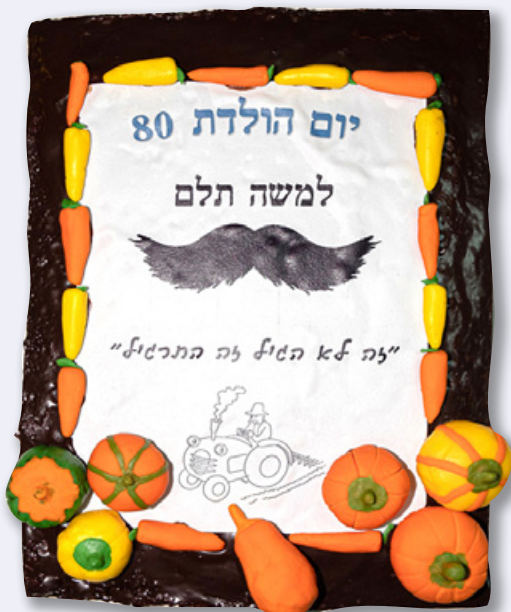
עוגת יום ההולדת עם השפם המפורסם