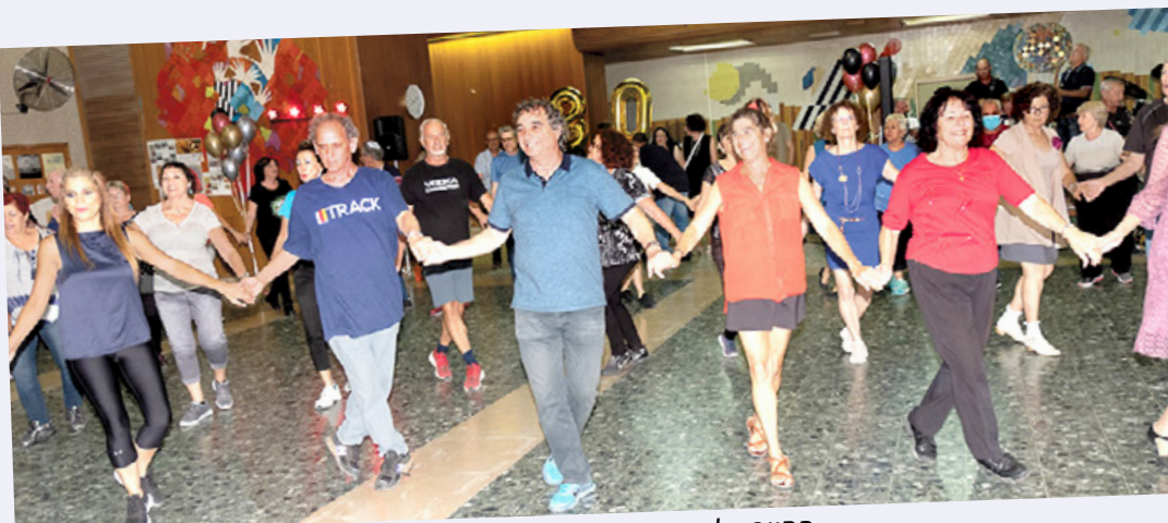
החיך על פני הרוקדים שאומר הכל