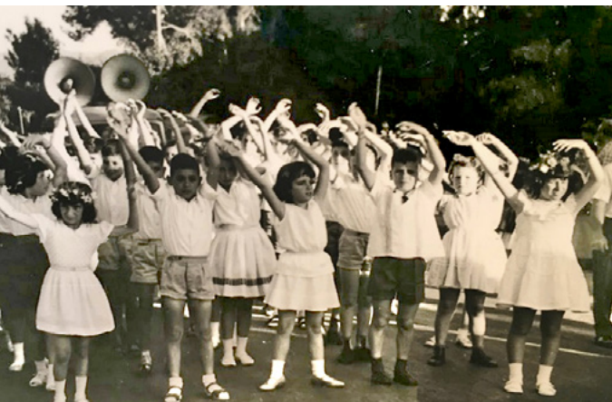
חוגגת עם ילדי בית הסר בנוה שאנן

קיבלתי הכל, אפילו מבלי שביקשתי. הייתי ילדה טובה, שובבה מאוד, קצת פרועה אבל לא הרבה... ומאוד ביישנית. מה שבלט אצלי מאוד הייתה הרגישות הגבוהה וחוסר הביטחון. אנשים חשבו שאני בכלל מתנשאת, אבל הכל היה מתוך ביישנות. ביסודי כאדם, אני לעיתים עדיין מרגישה חסרת ביטחון. לא תמיד אני מאמינה שעשיתי את הטוב ביותר. אני פרפקציוניסטית מטבעי. וגם לא קל להיות בת יחידה. רציתי מאוד אחים. אז פשוט אימצתי כלבים, אבל אמא שלי לא רצתה אותם. היה חסר לי מישהו שיהיה איתי בבית. היום ממרום שנותיי אני יותר מודעת. אצל הפולנים לא מדברים הרבה.