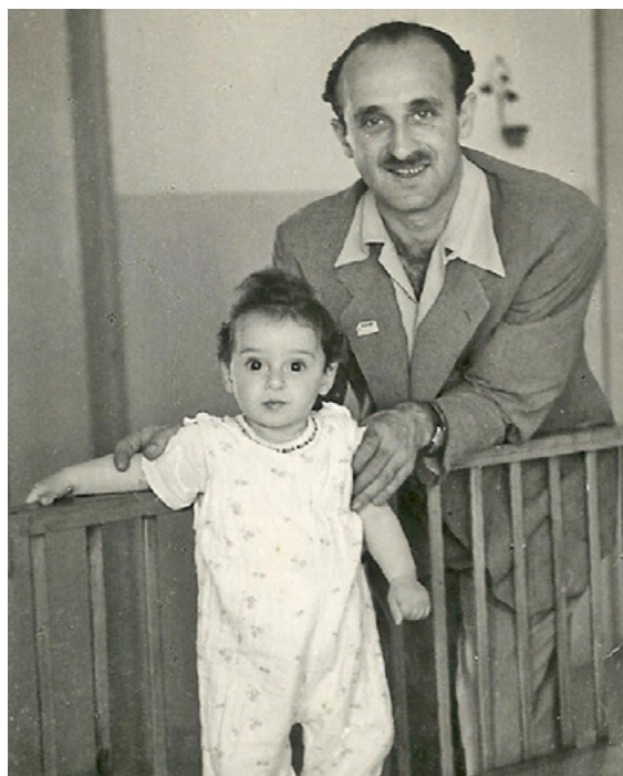
אני ואבא באומנה

אבא שלי היה איש אוהב, מחבק. הוא לימד אותי לשחות, לרכב על אופניים, לנהוג לימד עוד כשהייתי בת 10