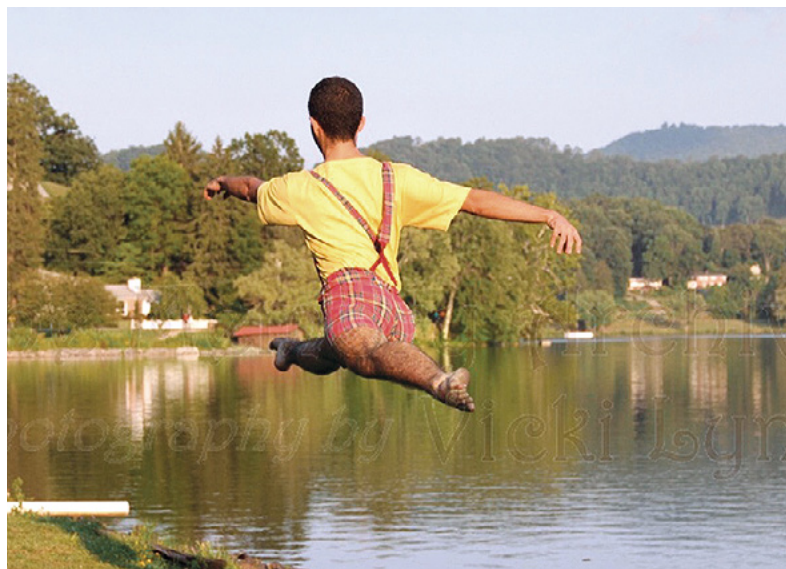
סתיו, סולן הלהקה, בז'אטה מדהים על רקע אחד האגמים בצפון קרוליינה

חוש קצב, כשרון בתנועה ובריקוד, כושר גופני ומנהיגות. הטובים ביותר מגיעים ללהקות. מלאכת בניית הרקדנים ואישיותם ידועה לי.