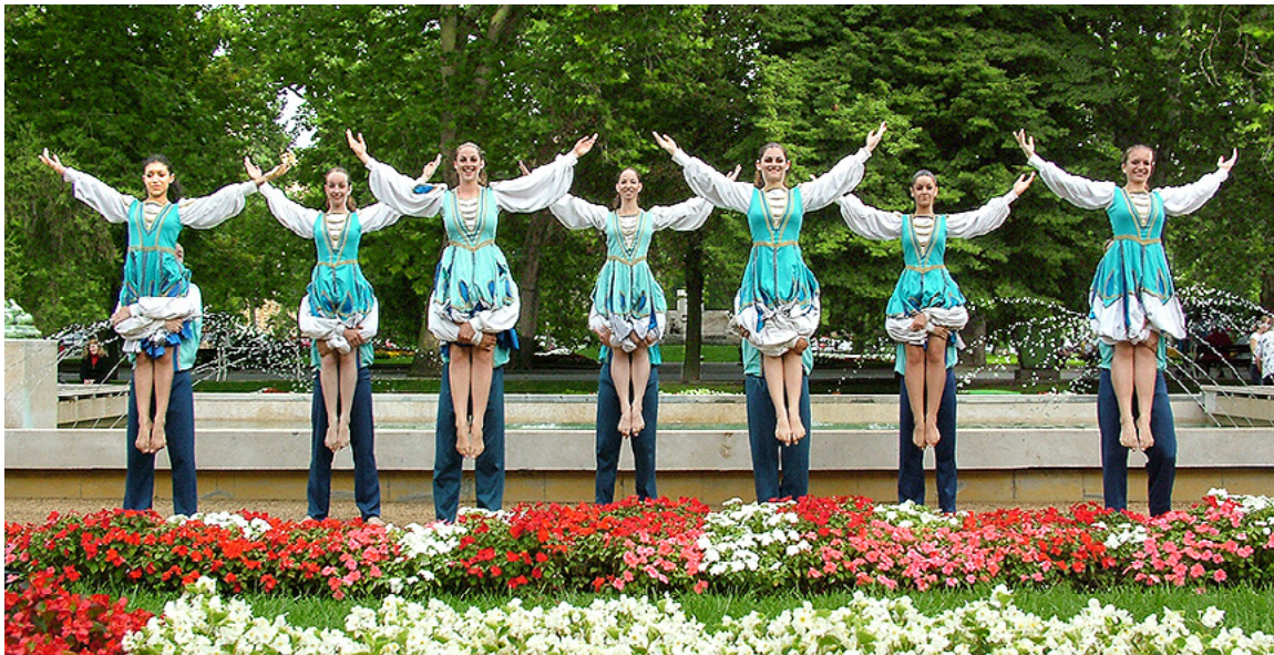
איילות הנגב בוגרים באחד הגנים בעיר סאגד בהונגריה