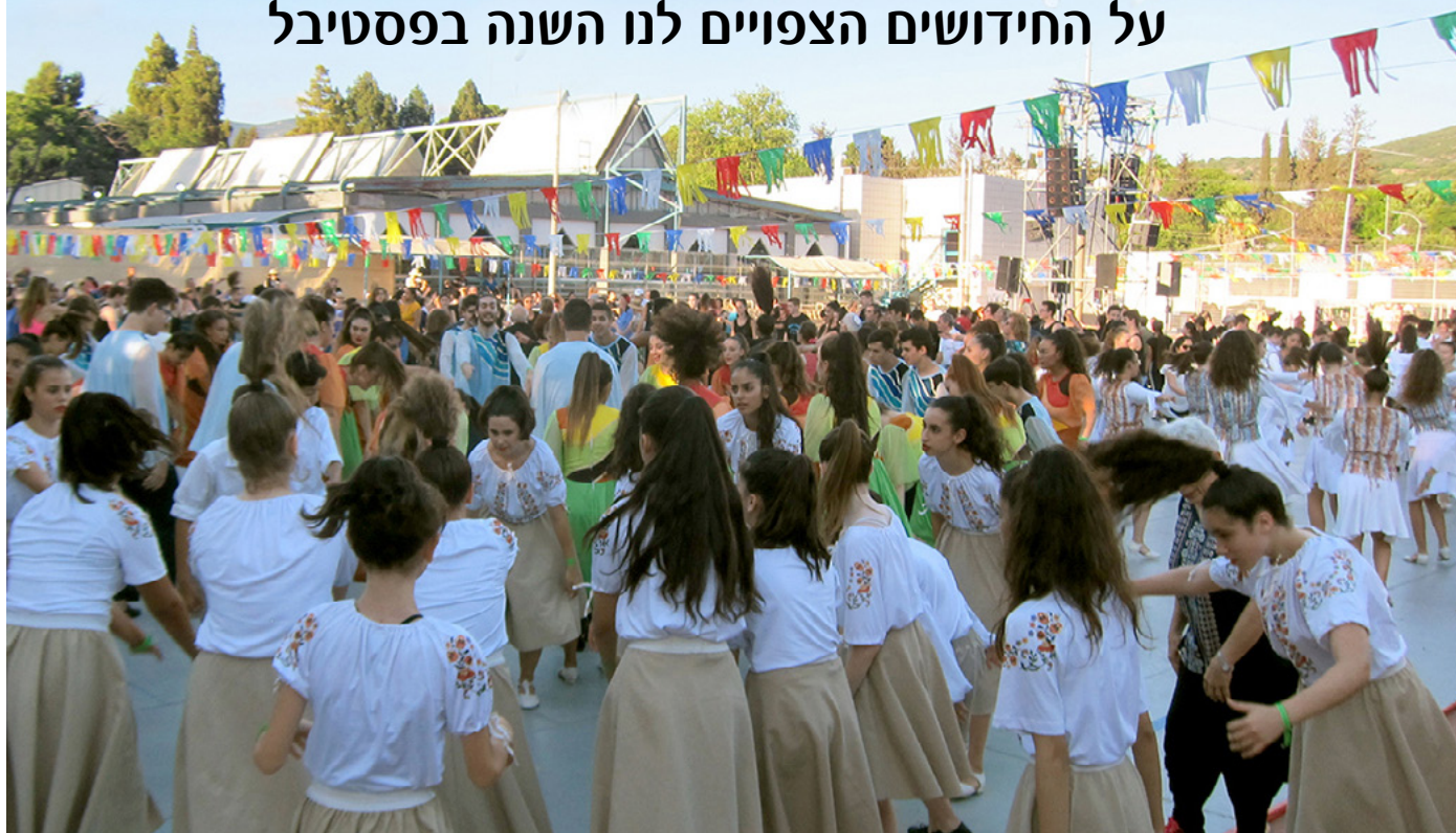
ההרקדה המרכזית בפסטיבל

פ סטיבל כרמיאל ה-35 כבר בפתח. זה יקרה ב-7-5 ביולי 2022. ההכנות, הרעיונות, החדשנות, הלוגיסטיקה העצומה, הכוריאוגרפיות, כבר מתמרקים לקראת האירוע התרבותי הענק הזה.