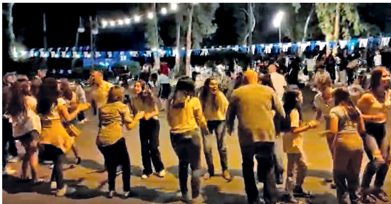
הריקוד "בים בם בום" בחגיגת עצמאות בקיבוץ עינת

בחוו"ל. בעבר חיברו "ריקודי עם" למען שיהיו ריקודים לעם, כיום בתמונה גם שיקולים נוספים כמו פרסום, מעמד, הכרה על ידי הרוקדים, הזמנה להדרכות בהרקדות אחרות ובעיקר בחוו"ל, ופעמים רבות, למרבה הצער, גם צורך לספק "ריקודים חדשים" למקומות אליהם הם מוזמנים.