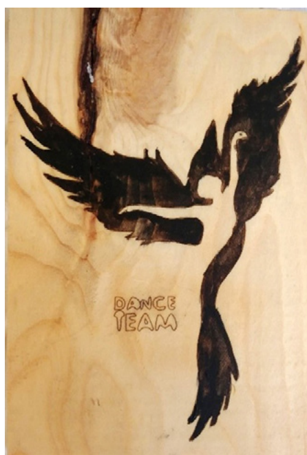
לוחית - ציפור רוקדת