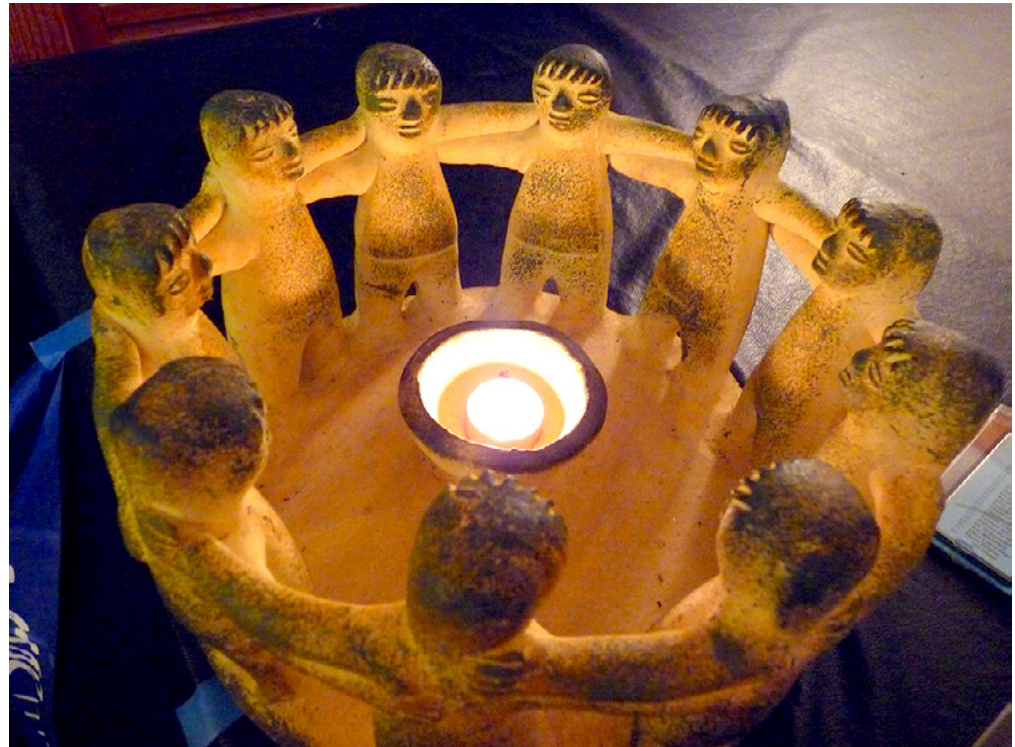
מעגל הרקדנים, פסל עם נר