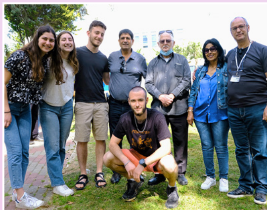
בני נוער מכפר הנוער עיינות