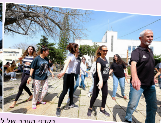
רקדני העבר של להקת כרמון, אורחים, ובני נוער מכפר הנוער "עינות" בהרקדה משותפת