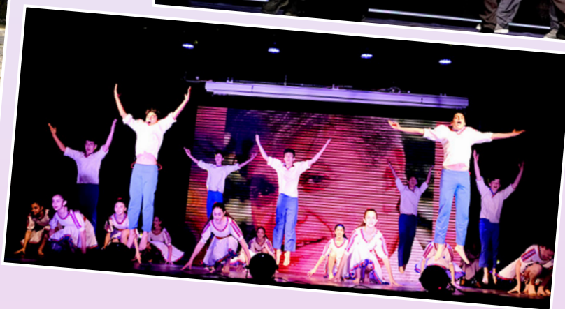
רקדני הורה אפרוחים ירושלים בריקוד "השתובבות" של יונתן כרמון