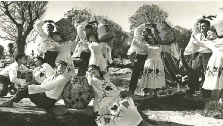
מחרוזת ריקודי יין