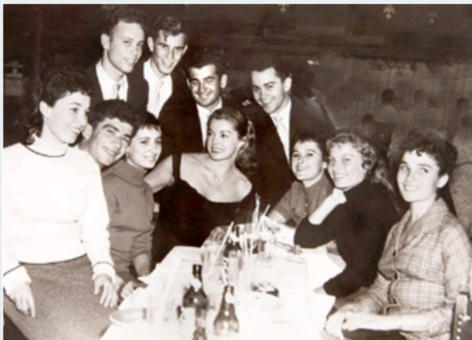
הלהקה עם אתר ויליאמס בניו-יורק 1958

סילבר, שמואל ויזי ועוד. מטרת התחרות הייתה לאתר אמנים ישראלים להופעה בתכניתו המפורסמת של אד סאליבן . בפרסום הראשוני של התחרות, נאמר שיבחרו 5 סוגי הופעות וסך הכל 8 אמנים.