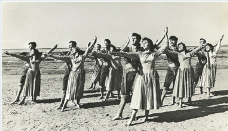
ריקוד הדייגים - הלהקה המרכזית