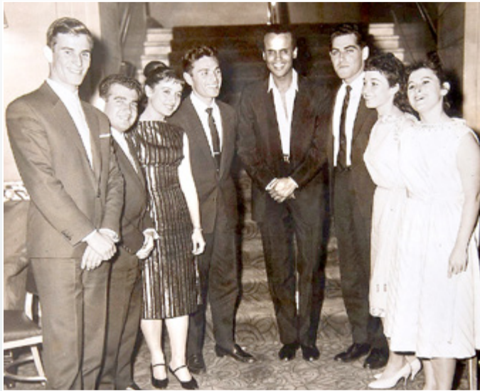
הלהקה עם הארי בלפונטה בניו יורק