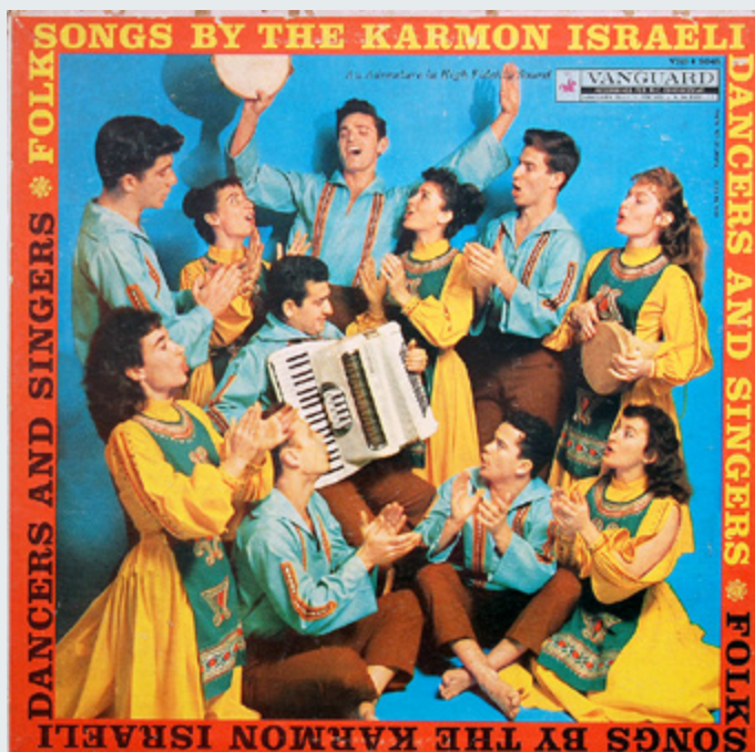
עטיפת התקליט הראשון של להקת כרמון

סילבר, שמואל ויזי ועוד. מטרת התחרות הייתה לאתר אמנים ישראלים להופעה בתכניתו המפורסמת של אד סאליבן . בפרסום הראשוני של התחרות, נאמר שיבחרו 5 סוגי הופעות וסך הכל 8 אמנים.