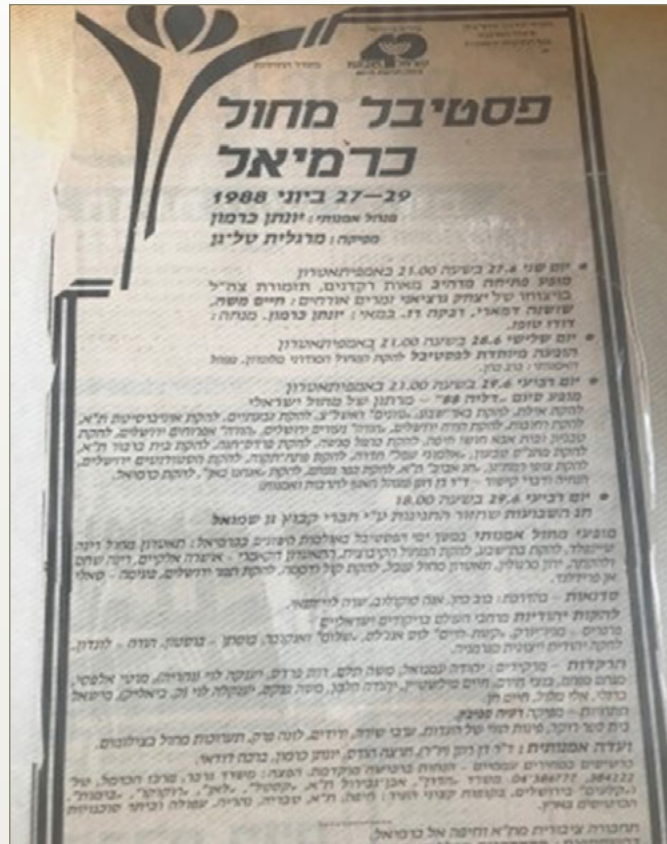
פסטיבל מחול כרמיאל 1988

רק יוצר ענק כמו יונתן כרמון, עם התעוזה והכריזמה שלו יכול היה לגייס באמצעים הדלים שעמדו לרשותנו רשימה כל כך מרשימה ומגוונת של כוכבים.