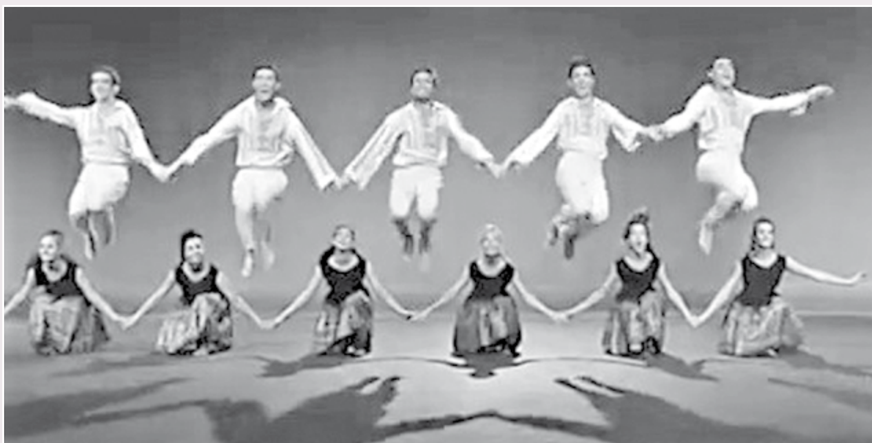
להקת כרמון - שירו השיר

סיפורי כרמון בשפת המחול לבמה מתארים בקסם רב את אהבתו לעולם הטבע הארץ-ישראלי, והמחשת נופי הארץ ואנשיה, על ידי "סיפורי מחול".