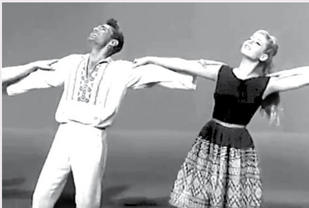
להקת כרמון - שירו השיר