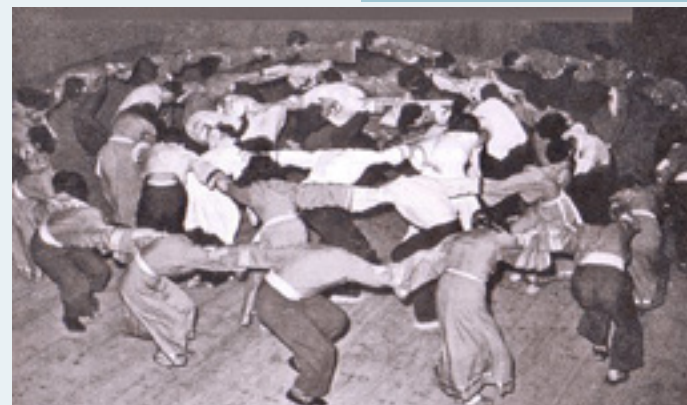
ריקוד העמק, 1954