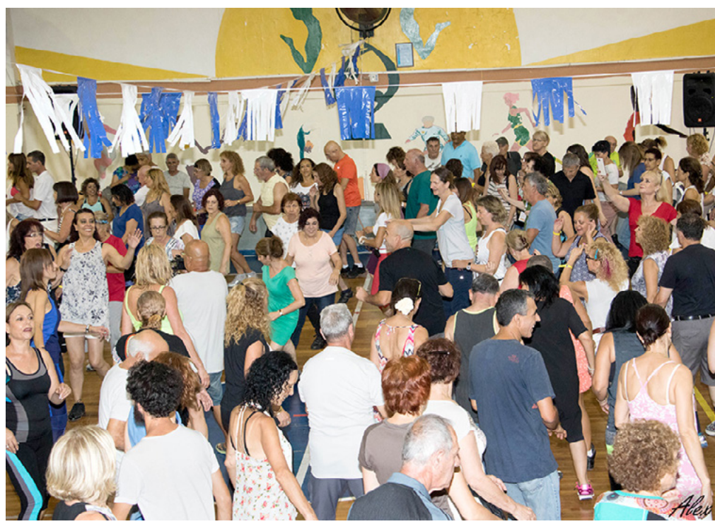
פסטיבל מחולות כרמיאל 2016