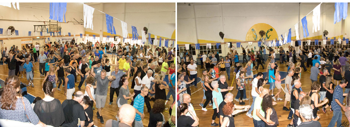
פסטיבל מחולות כרמיאל 2016

מושיקו: "מלכתחילה היה האינטרס של מחבר הריקודים לקבל הכרה מן הרוקדים בישראל, ולא על מנת לקבל פרס כלשהו."