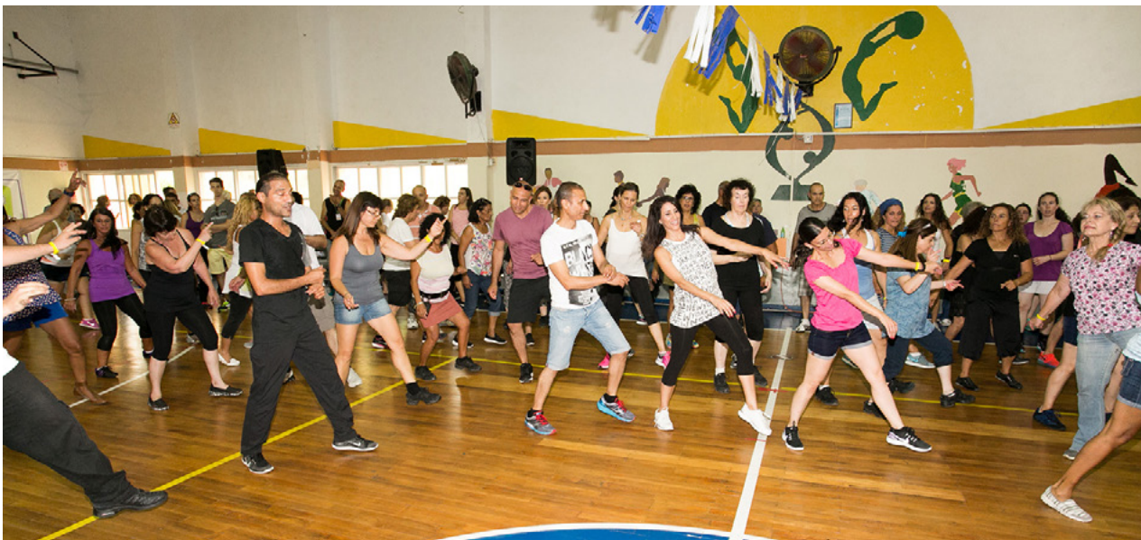
פסטיבל מחולות כרמיאל 2016