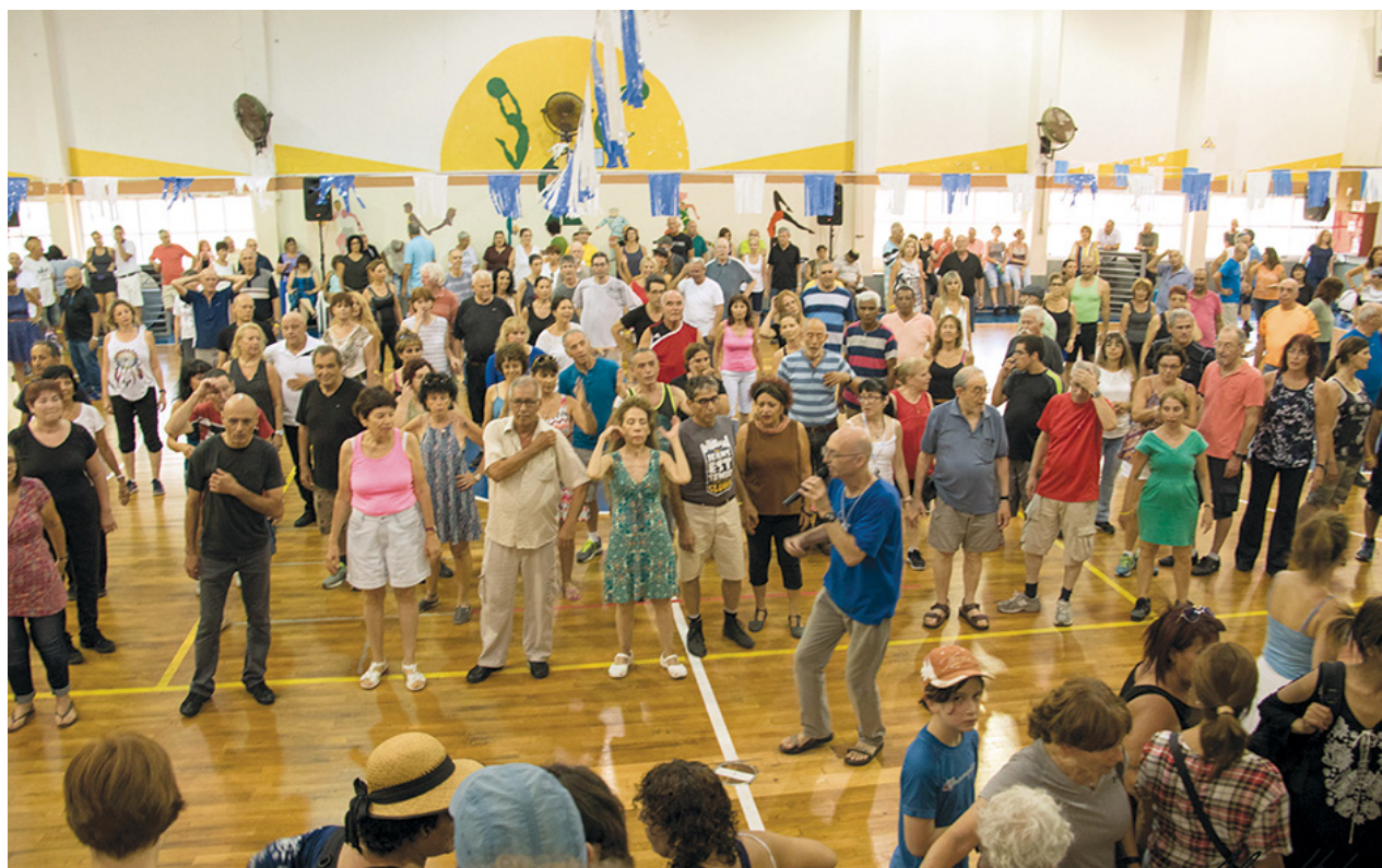
פסטיבל מחולות כרמיאל 2016

לדעתי, כל יוצר, כמו כל נותן שירות, חייב שיקבל גמול על הקניין שלו, שאנחנו עושים בו שימוש.