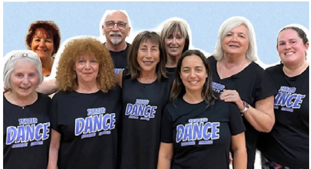
קבוצת המדריכים של “הורה” מלבורן.