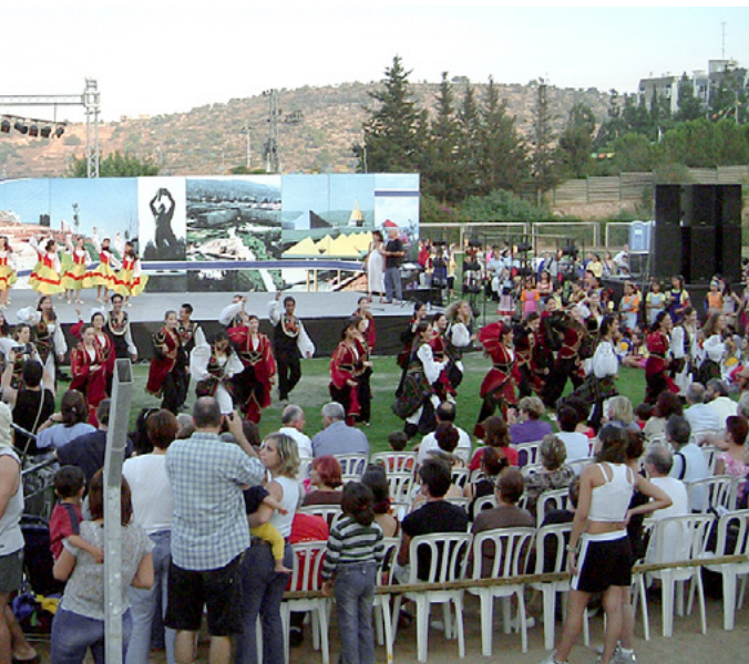
הרקדת הפתיחה בפסטיבל כרמיאל 2003

בשביל הצופים בנו מהצד, ה"פלא" וההנאה נובעים מהעובדה שאנשים פשוטים, אנשים כמותם יודעים כל כך הרבה תנועות ונעים ביחד לצלילי השירים השונים.