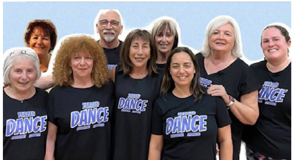
קבוצת המדריכים של "הורה" מלבורן.