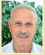
דוד בן אשר