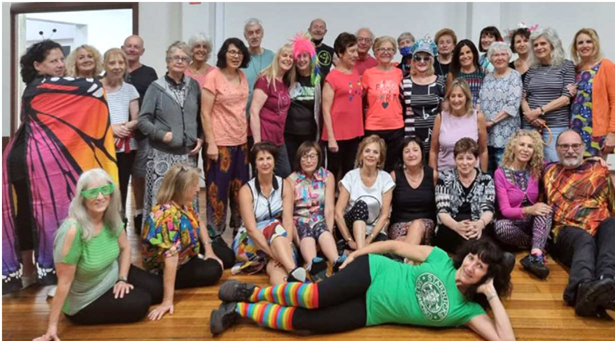
החברה של נרקודה בתמונה משותפת

המטרות של "נרקודה" פשוטות: הריקוד ביחד מייצר תחושה של להיות חלק מקבוצה חמה וחביבה סביב אהבה משותפת למוזיקה, תרבות ותנועות גוף ישראלית