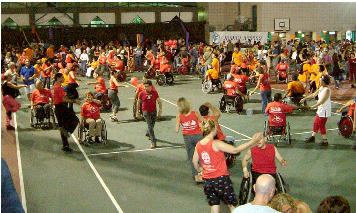
רוקדים בכסאות גלגלים, כרמיאל 2003

התוצאה הבלתי נמנעת הינה ציבור גדול של רוקדים (הגדל והולך כל הזמן) המבצעים את הצעדות בשיטת "העתק- הדבק"