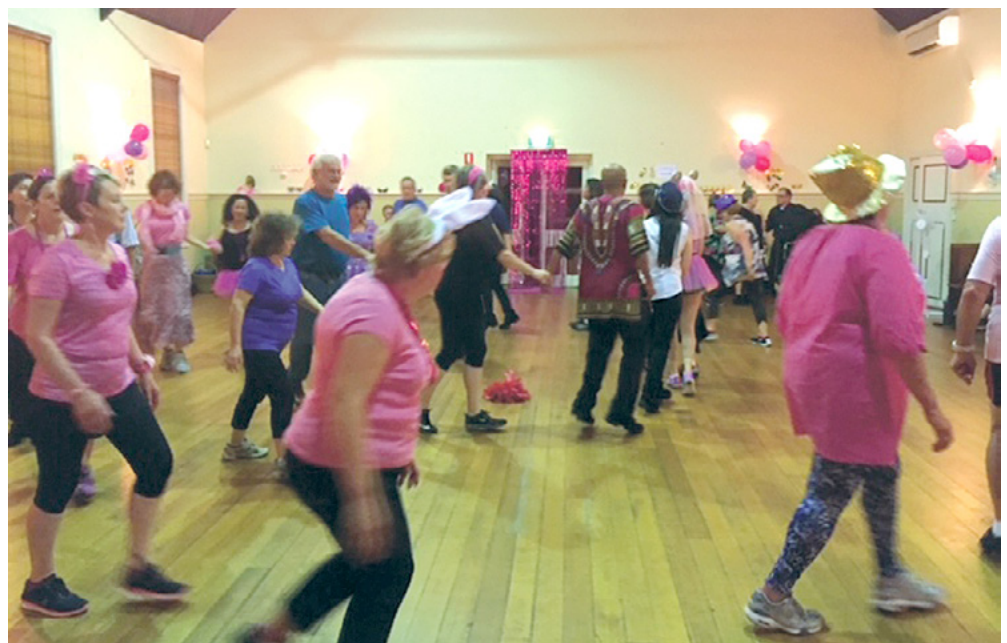
הרקדה במסיבת פורים במועדון "Zooz"

רישל מייחסת חשיבות לכך שהמורים שהיא מכשירה ילמדו את הטרמינולוגיה ושיטות