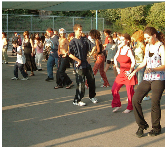
פסטיבל כרמיאל 2003