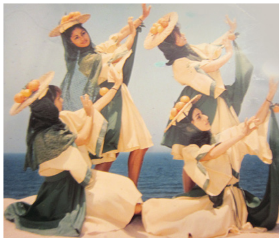
ריקוד ההדרים, להקת הצימבלים