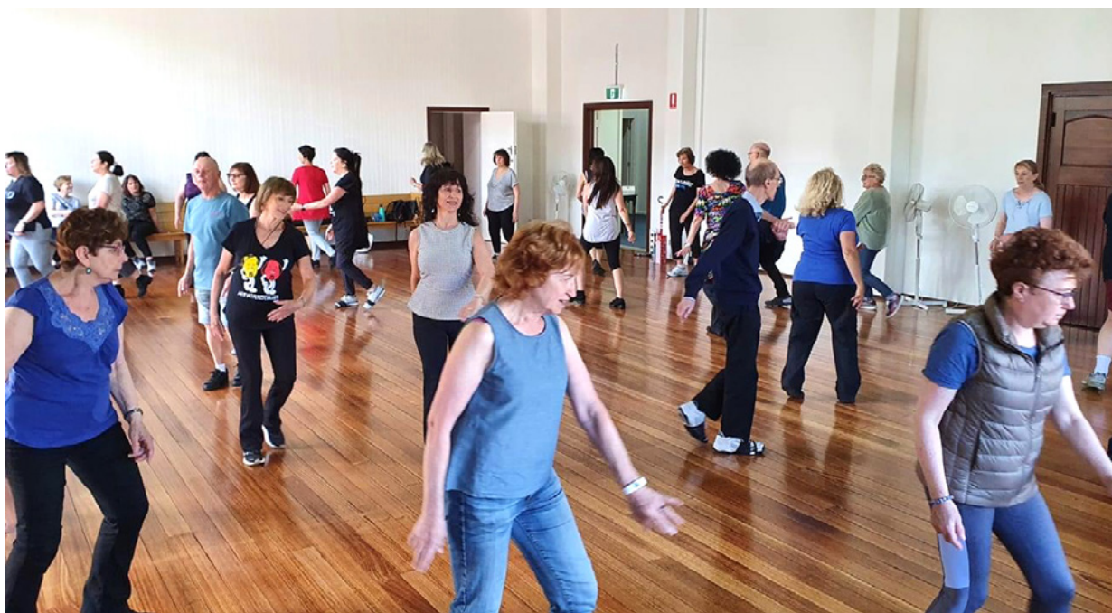
הרקדה במועדון הריקודים "נרקודה"