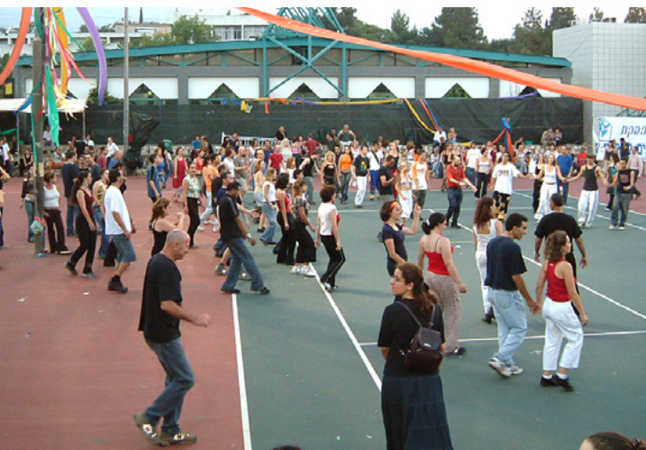
רוקדים בבוקר בכרמיאל

מתשובתו הבנתי אז והיום אני מבין הרבה יותר, שאני לא מלמד "ריקודים" אני מלמד אנשים "לרקוד", מלמד צעדות יסוד, תבניות, מקצבים, קואורדינציה ובעיקר אני מלמד אותם את התענוג של "תנועה ביחד".