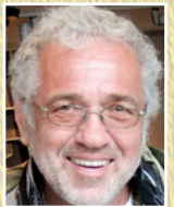
מתי גולדשמידט תרגום מאנגלית: אלכס הובר

ריקודי העם שלנו קיימים בכל פינות העולם, גם בפינות רחוקות והכי לא צפויות... עד היום במגזין "רוקדים-נרקודה" הבאנו כתבות שרובן המכריע היה על הנעשה בארץ. כעת אנו רוצים לפתוח את העיתון למידע על כל המקומות בעולם בהם רוקדים ריקודי עם ישראליים. חשוב שנדע איך התפתחו הריקודים שלנו בכל מקום ומקום, מי האנשים המניעים את התנועה הזו, מה הם חושבים ועושים, נכיר את קהילות הריקודים השונות. אנחנו מתחילים עם אוסטרליה.