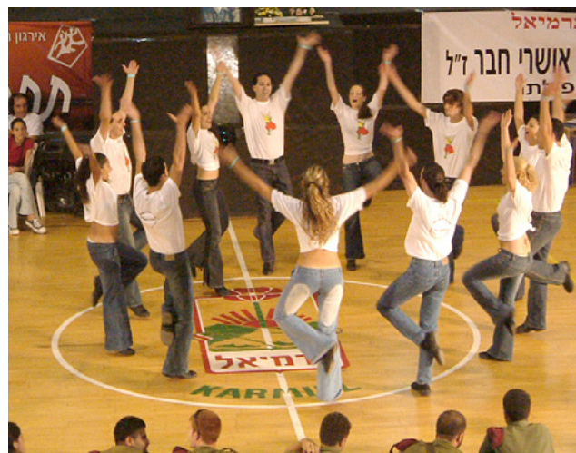
תחרות המחול העממי בפסטיבל כרמיאל

אני לא מלמד "ריקודים" אני מלמד אנשים "לרקוד", מלמד צעדות יסוד, תבניות, מקצבים, קואורדינציה ובעיקר אני מלמד אותם את התענוג של "תנועה ביחד".