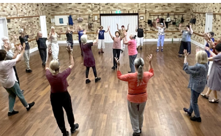
הורה שלום הפרת'

בשנת 1973, השתתפה בקורס מדריכי ריקודי עם ("אולפן") בחיפה. מוריה היו, בין כמה אחרים, יונתן גבאי, תמר אליגור, בנצי תירם, יענקל'ה לוי ותרצה הודס (תיבדל לחיים ארוכים). הריקודים הישראליים אליהם נחשפה בביקוריה בערי אירופה, בעיקר באמסטרדם, הובילו להחלטתה להקים קבוצת רוקדים כזו בפרת' שהופיעה עם ריקודים ישראליים באופן קבוע.