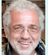
מתי גולדשמידט תרגום מאנגלית: אלכס הובר