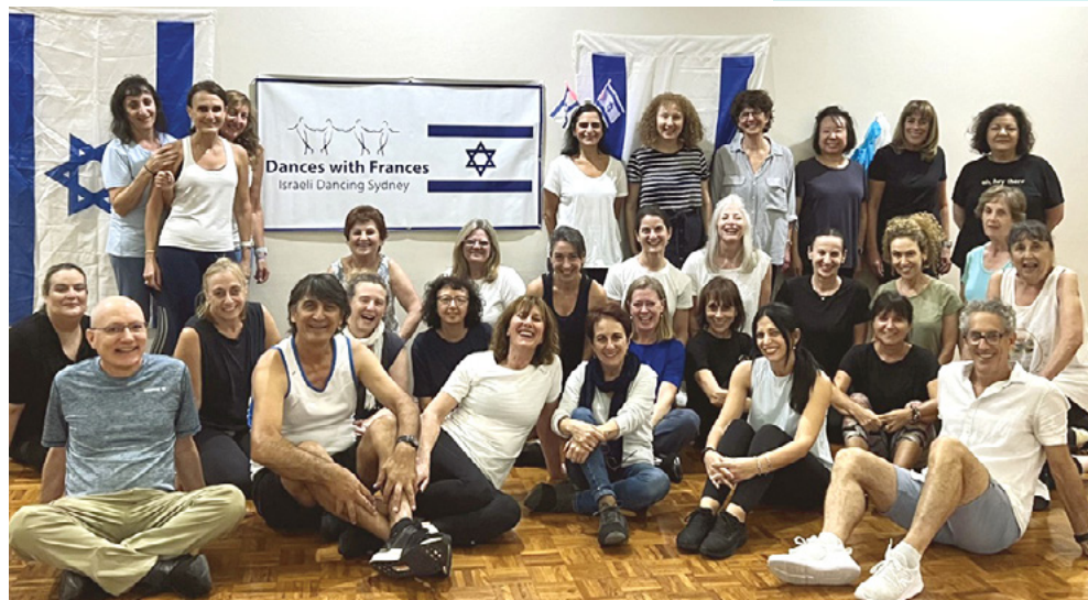
קבוצת ריקודי עם בסידני

צעירים ישראלים, שנסעו לאחר שירותם הצבאי לדרום מזרח אסיה, האריכו לעתים קרובות את שהותם בחו"ל גם בסידני והגיעו תכופות לשיעורים