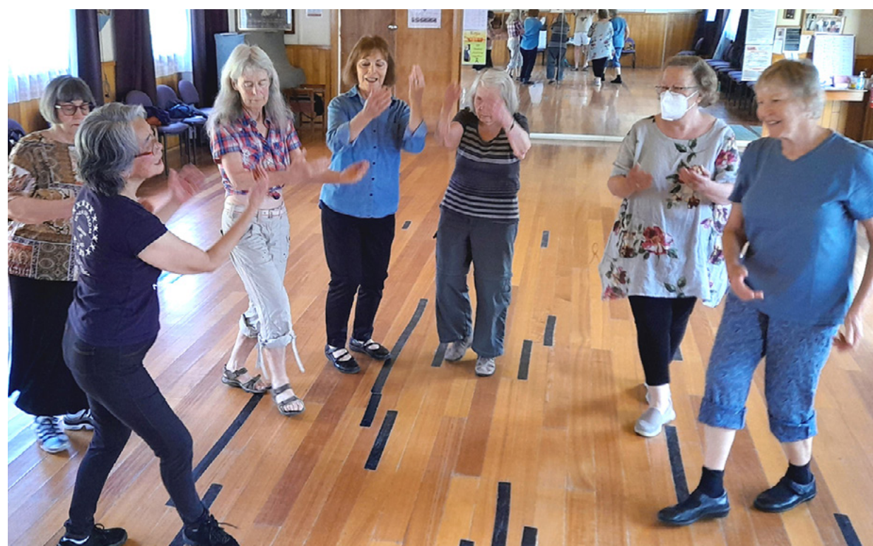
רוקדים עם מיחיקו גאוג' - הורה טסמניה. אוסף תמונות פרטי