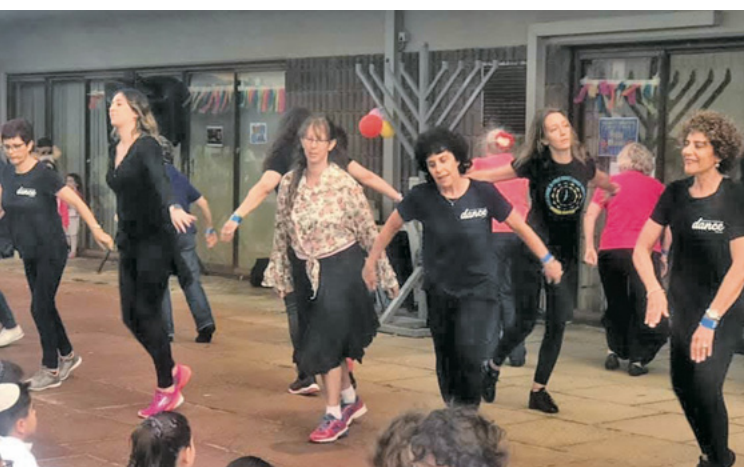
"הורה מכבי - פרת', חנוכה 2021."

הפילוסופיה הבסיסית שלהם היא "למלא את לבבותיהם של הרוקדים בשמחה, להעריך את החברות והאחוזה", שזה מה שבסופו של דבר שיעורי הריקוד שלהם מספקים.