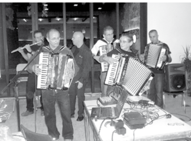
קבלת שבת עם אקורדיונים