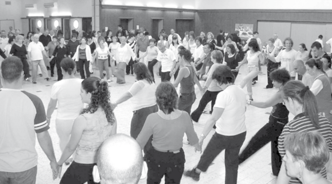
מעגל הרוקדים בגניגר. שימו לב לאחזית הידיים