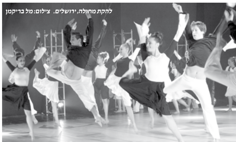
להקת מחולה, ירושלים.