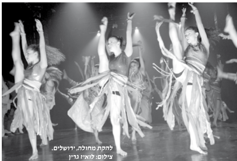
להקת מחולה, ירושלים.

על התחנה ממש לאחרונה, הקימה להקות ושלוחות של מחולה, משמשת ככוריאוגרפית ומנהלת אומנותית