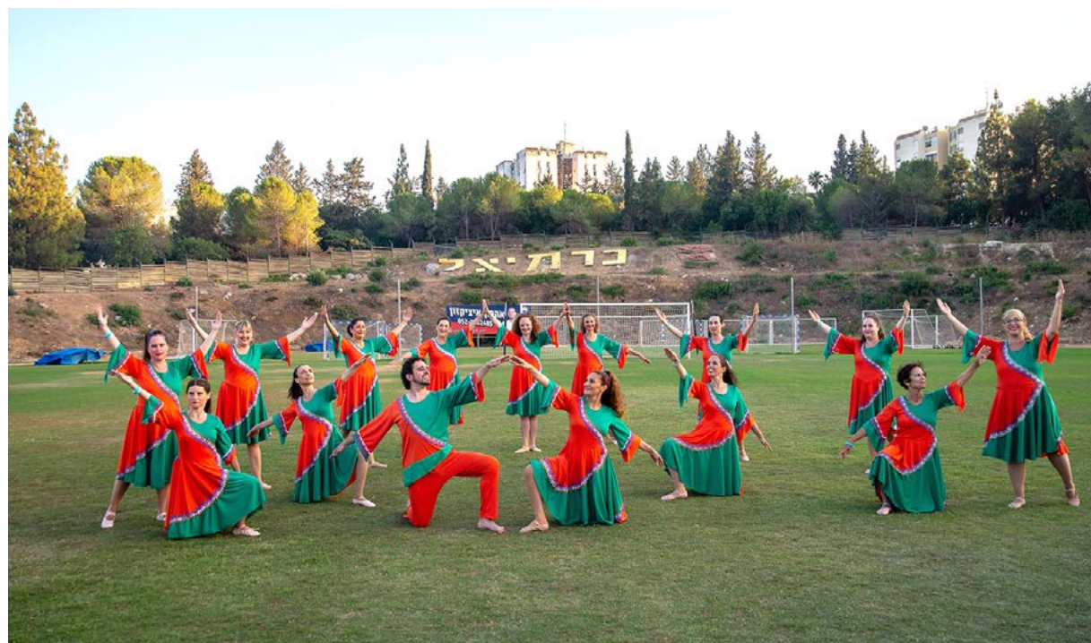
להקת הכל במחול בפסטיבל כרמיהל 2022 עם תלבושות הריקוד "ההר הירוק תמיד"

את השאלה הזו צריך להפנות לרקדנים - אם יש בי כריזמה או יכולות מסוימות. הקבוצה של "הכל במחול" נתנה לי הרבה במה וכבוד, וגם את השם. זה היה דואלי - ברגע שהם נתנו לי מוטיבציה, אני נתתי להם. כשאני נכנס כבוי לשיעור אז זה מחלחל אל הרקדנים, ולהיפך. אני מחכה לעבודה איתם. עברנו לפגישות של פעם בשבוע וזה קשה עבורי כיוון שאני בהמתנה. לעיתים צצה איזו פנטזיה ואני רוצה כבר לבדוק שזה עובד ו"לשפוך את זה על הרקדנים". יש הרבה לילות בלי שינה, עם חלומות ומחשבות. ואז אני מגיע פעם בשבוע לחזרה והיא נגמרת לי מהר. אני לא מספיק לעשות את מה שתכננתי וצריך לחכות עוד שבוע.