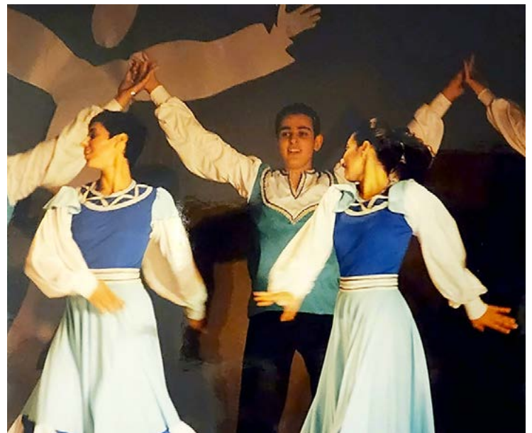
מחוללי קרית חיים בריקוד "הכל פתוח", כוריאוגרפיה: שלמה ממן

לדעתי קשה מאוד למי שאינו רקדן להיות כוריאוגרף, אף על פי שקיימים כוריאוגרפים כאלה וחלקם גם מצליחים. ללא ניסיון ריקוד הכוריאוגרף יצור דברים יותר גרפיים, שאולי יהיו מדויקים מבנית, אבל לא יהיה לו את המעוף שיש לרקדן שמבין וחש את משמעות המכניקה של הגוף, את אורך התנועה ועוד הרבה ניואנסים חשובים. לעיתים במהלך העבודה אני זז רגע הצידה ומנסה לבצע את הרעיון בעצמי. אני יודע מה אני יכול לבצע ומה הרקדן יכול לבצע ואני צריך לעשות התאמה.