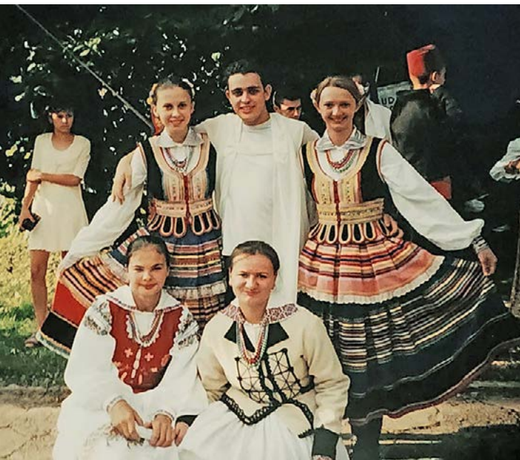
צילום קבוצתי בפסטיבל עם הלהקה הפולנית, לפני מופע בכיכר העיר טומשוב

- לשאול את עצמי שאלות, לכתוב, להסתכל במילון, ליצור. אני מנסה להלביש את הסיפור שעלה מתוך המוסיקה הזו ולהגיע לנקודה בה אני מתחבר עם הרעיון שלי מצד אחד ועם המוסיקה מצד שני, כדי לעשות איזה קולאג' יחד.