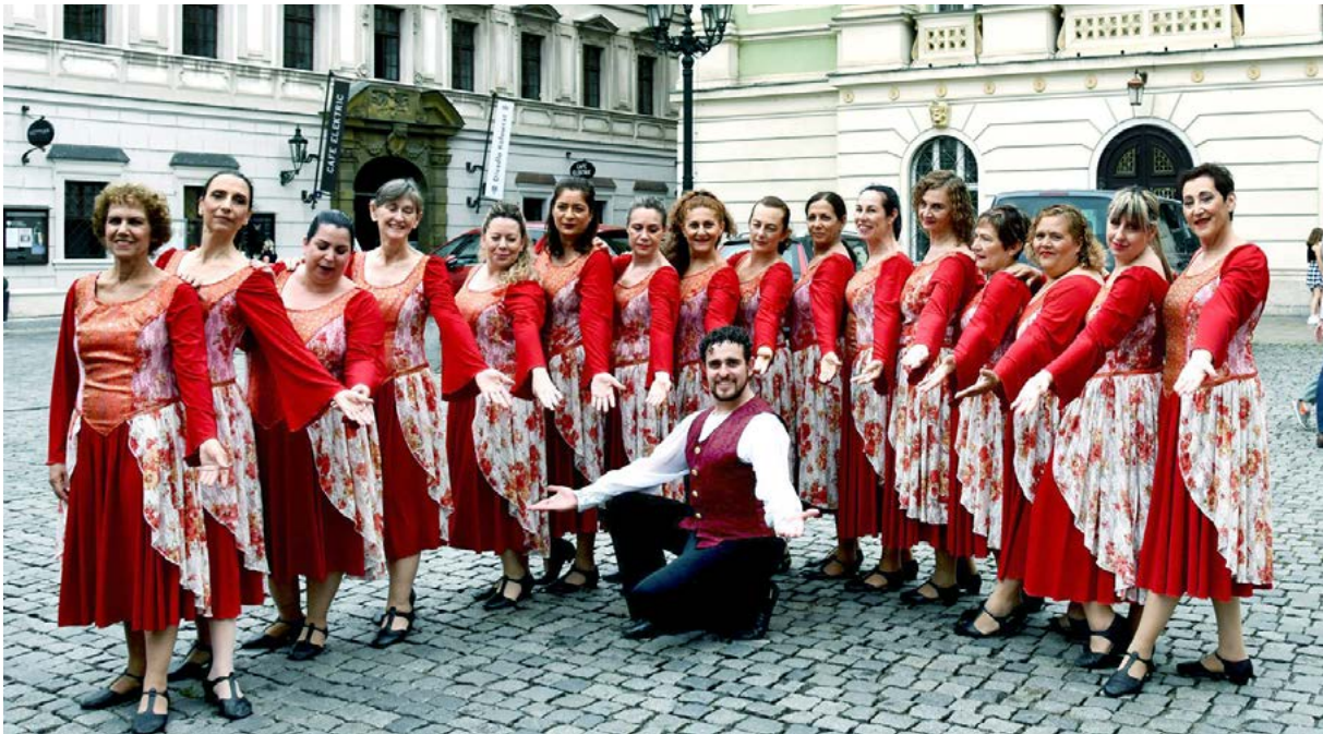
להקת הכל במחול בפסטיבל בפראג בשנת 2019

אז אני אוסיף שאתה גם מאוד משעשע את חברי הלהקה בחיקויים שאתה עושה לעיתים, ושיש לך גם כישרון משחק שכמובן בא לידי ביטוי על הבמה, אבל גם במהלך החזרות.