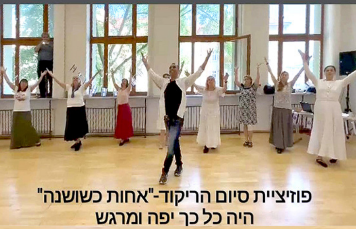
פוזיציות סיום הריקוד - "אחות כששנה" היה כל כך יפה ומרגש

"כוחנו באחדותנו" והדרך שלנו להעביר את אחדותנו לעולם "שבחוץ" היא דרך אחיזת הידיים במעגל המסמלת לנו ולכל הרואה אותנו את ה"ביחד" שלנו כקבוצה.